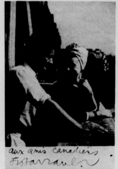
Madeleine RENAUD et Jean-Louis BARRAULT, à Paris.

Le spectateur est transporté dans la coulisse d'un théâtre d'opéra; les vedettes, accompagnées d'un pianiste, interprètent des extraits de La Traviata , de Verdi, d' Il Trovatore , d' Hérodiade , de Massenet, et de quelques comédies musicales.