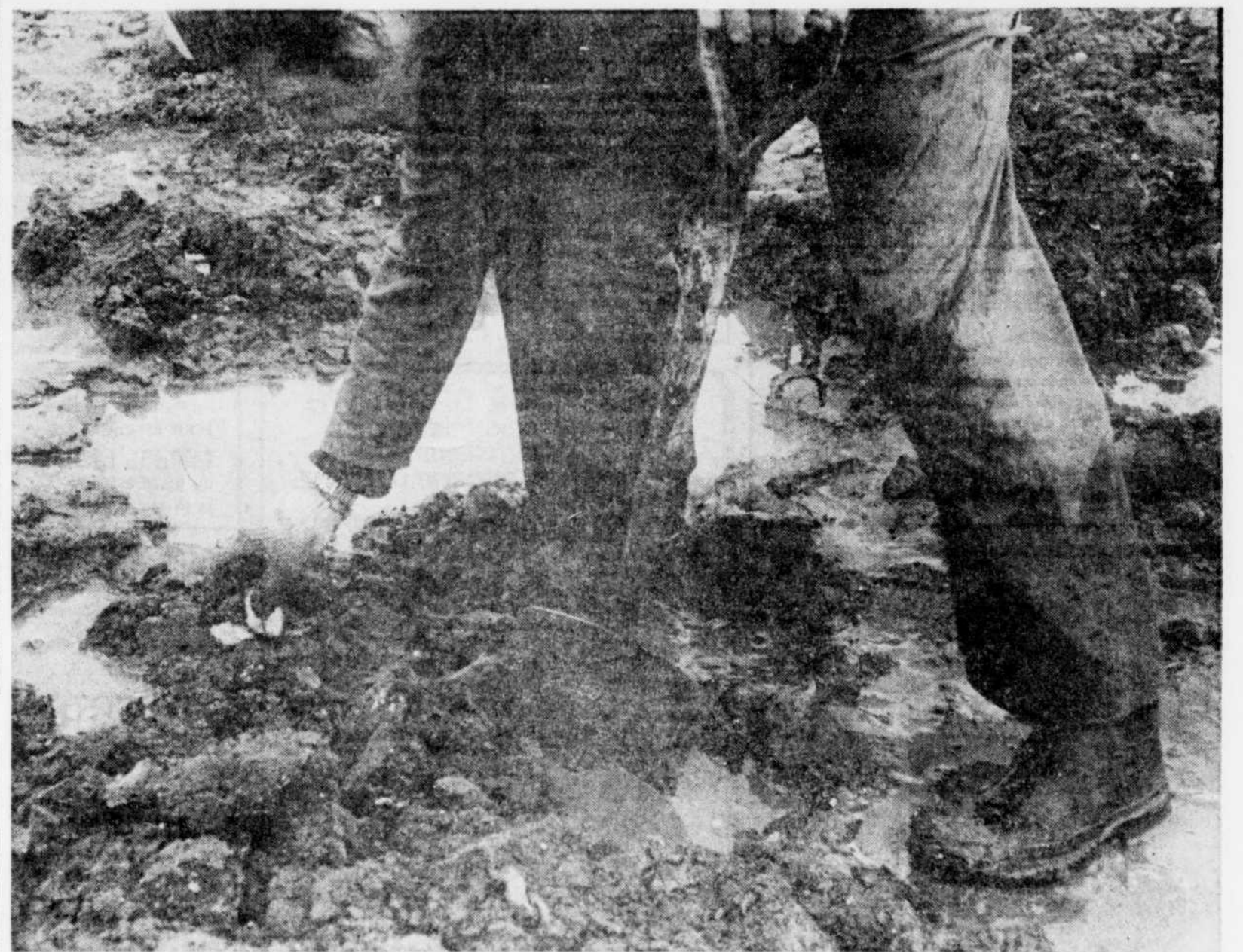
Un coup de pelle et, avec un peu de chance, on peut parfois sortir jusqu'à une douzaine et même davantage de ces petits bivalves.

Cuites dans leur eau, jusqu'à ce qu'ouvre la coquille, elles constituent un mets délicieux, que l'on dégustera avec de la bière ou un bon vin. Mais on peut aussi les faire frire, les manger en soupe, et sont à ce titre certainement aussi versatiles que les hultres, et tout aussi recherchées dans l'Est du Québec.