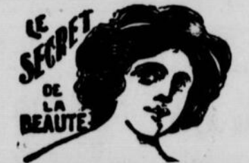
LAIT DES DAMES ROMAINES