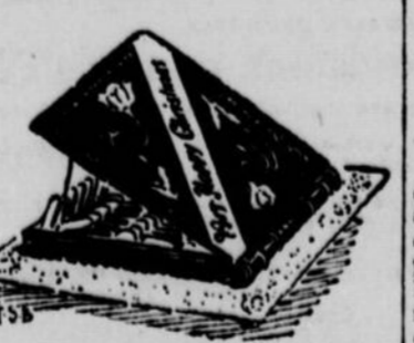
Le contenant est aussi délicieux au goût que le contenu.

d'artiste en bonne cuisine, en peinture et en sculpture. L'hôtel Corona a envoyé un 'travail' intitulé le 'Char de Neptune.' Comme détail, c'est exquis et comme idée, fort original. L'hôtel Savoy expose trois morceaux dont le principal est une magnifique saumon admirablement préparé. Nous ne parlerons pas des salades, galantines, etc., qui nous ont bien tentés.