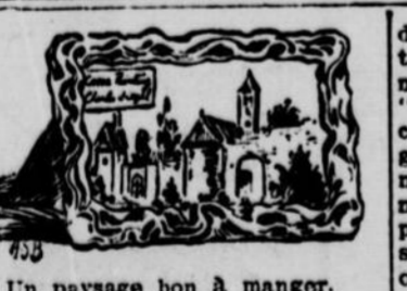
Un paysage bon à manger.