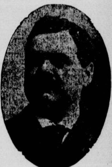
SIR LOMER GOUIN, président de la conférence interprovinciale, qui fut l'hôte hier de Sir Whitney à un dîner d'état à Toronto.

TORONTO, 15. — L'événement le plus important de la visite de Sir Lomer Gouin, à son collègue d'Ontario, est sans contredit le discours-programme qu'a prononcé Sir Lomer Gouin, président de la conférence interprovinciale.