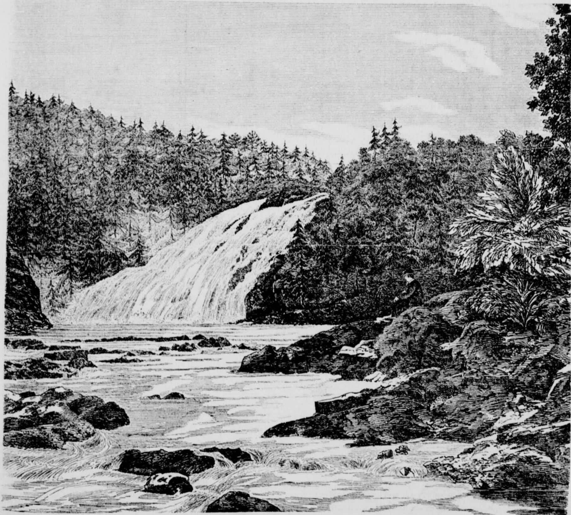
CHUTES DE LA RIVIERE DU LOUP. (EN BAS).

Il marcha ensuite lentement au devant de l'ennemi. Ses soldats essayèrent, mais vainement, de l'empêcher, et le général continua de s'avancer au milieu d'un feu très vif. Les soldats qui retraits, électrisés par ce spectacle, se lancèrent de nouveau sur l'ennemi, mais ils tombèrent presque tous autour de leur général qui s'avancait toujours. L'ennemi envoyant une autre terrible charge, le général Douay, qui n'avait plus autour de lui que quelques soldats, tomba mort sur le champ de bataille.