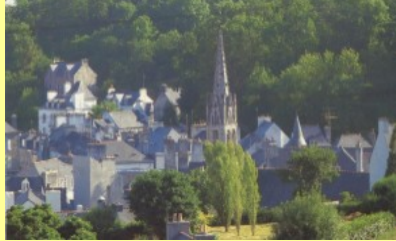
Dans mon pays, il faut toujours compter avec les marées.