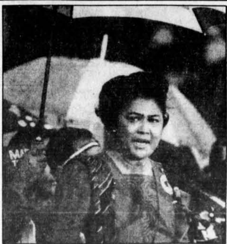
Imelda Marcos s'adresse sous la pluie à quelque 150 000 personnes rassemblées pour le dernier meeting politique du président philippin avant les élections de demain.