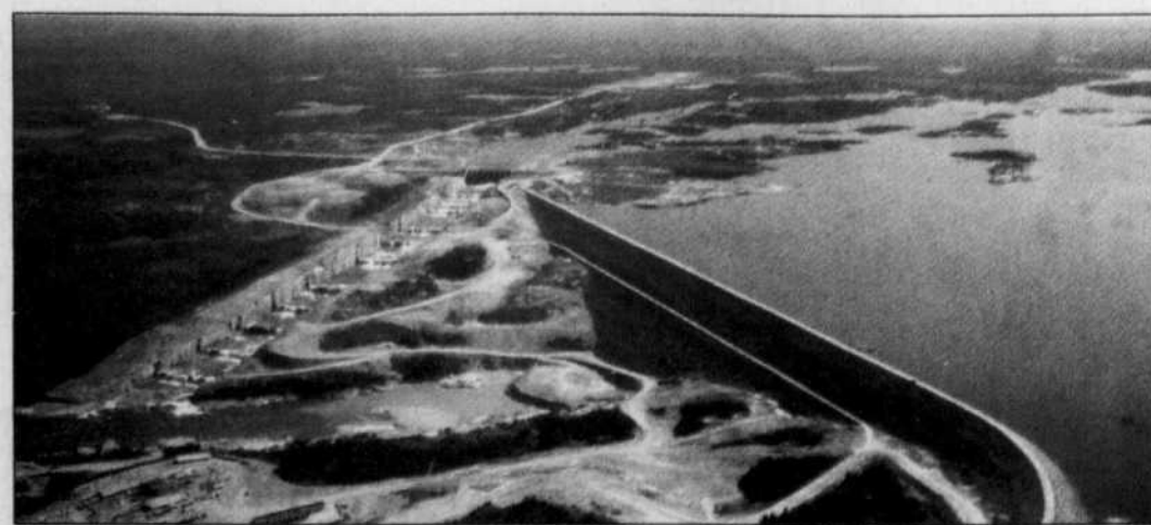
Le barrage LG-2 sur la rivière La Grande. Les réservoirs d'Hydro-Québec émettent de grandes quantités de gaz à effet de serre que le Québec ne comptabilise pas encore.

En vertu du mode de calcul annexé au protocole de