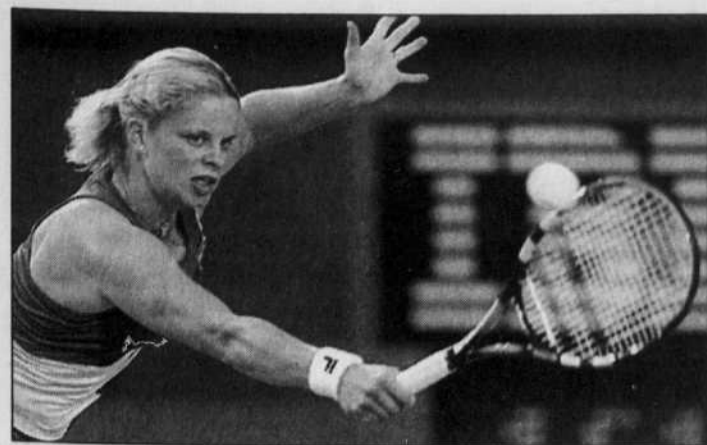
La Belge Clijsters a battu hier l'Allemande Marlene Weingartner 6-3 6-2.