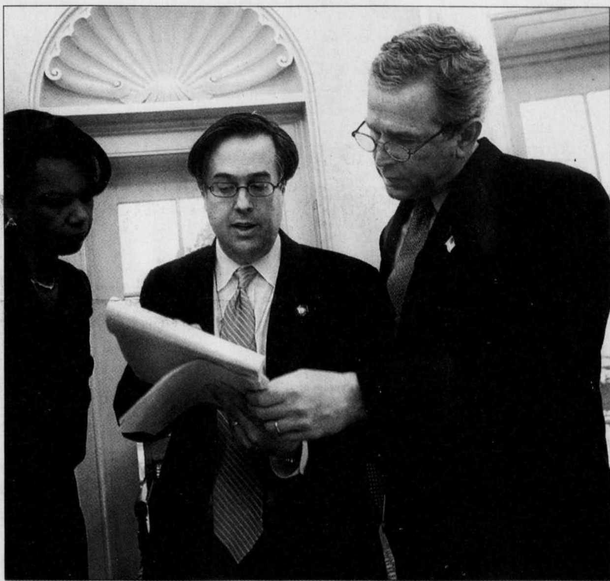
Le président américain, George W. Bush, révisant le discours sur l'état de l'Union, en compagnie de la conseillère pour la sécurité nationale, Condoleezza Rice, et du directeur de l'équipe de rédaction des discours, Mike Gerson.