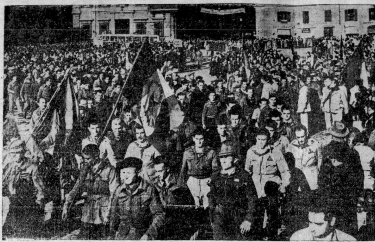
Des troubles fomentés par les communistes ont éclaté récemment en Italie. Avant le grand signal de grève générale, une "armée" de 50,000 ouvriers, dont les vêtements portaient une marque de rouge, ont formé un cortège funèbre pour un communiste tué au cours d'une bagarre à Rome.

C'est un éblouissement de lumières, de panneaux-reclames sensationnels, de théâtres immenses. Au milieu de tout cela