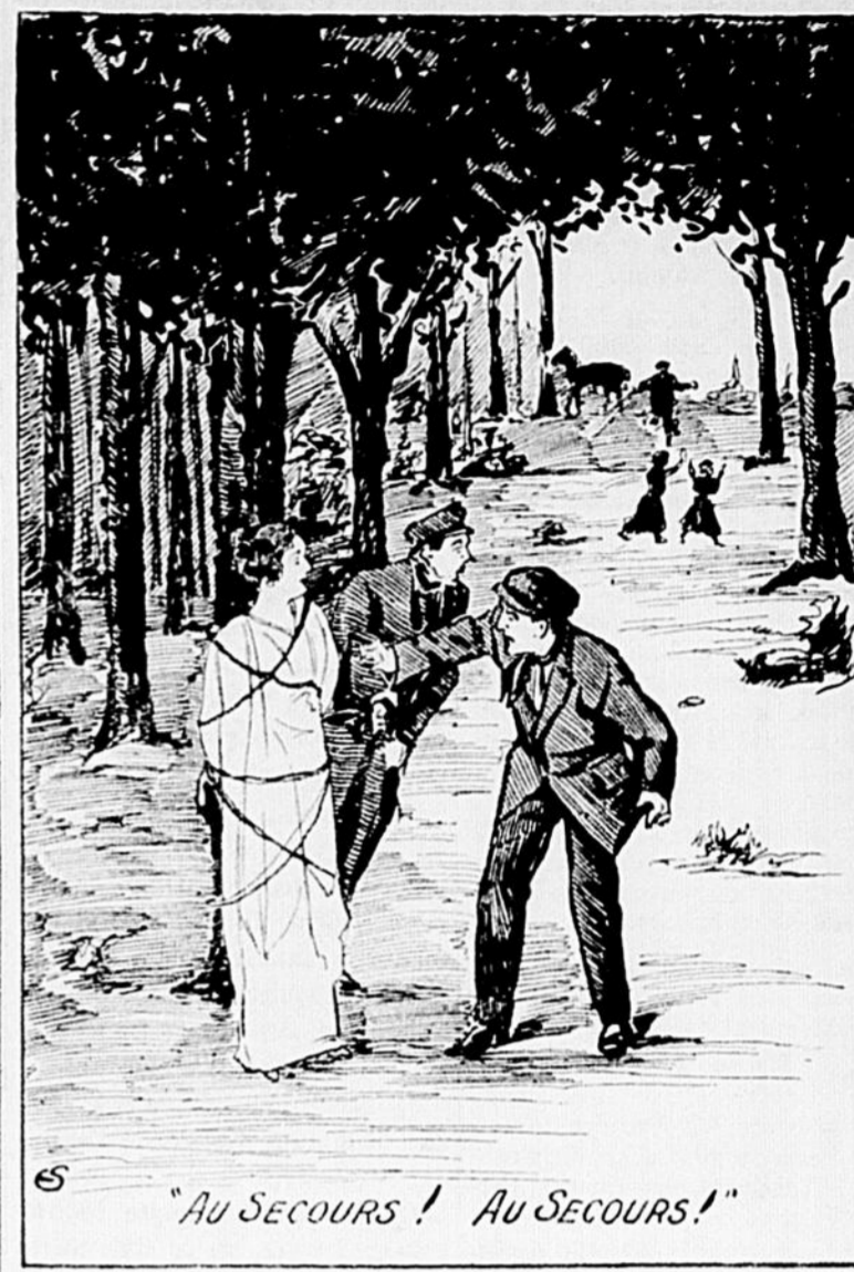
"AU SECOURS! AU SECOURS!"

Une ménagère qui s'en va au marché par le temps qui court, est sûr de revenir aussi allégée de son argent que si elle avait été dépouillée au coin d'un bois.