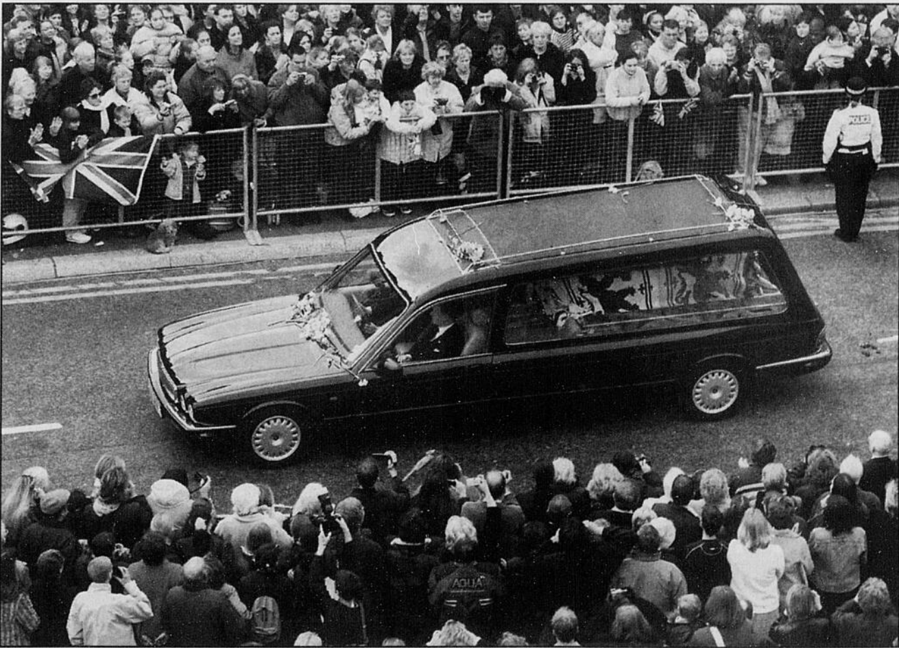
Un million de personnes étaient présentes le long du parcours du cercueil de la reine mère dont les funérailles ont eu lieu hier.

personnel d'Elizabeth et surmonté de sa couronne sur un coussin de pourpre a été suivi jusqu'à l'abbaye par le duc d'Edimbourg (Philip, époux d'Elizabeth II, l'actuelle souveraine, fille de la reine mère), les princes Charles, Andrew et William, la princesse Anne et d'autres membres de la famille royale, la plupart en tenue militaire.