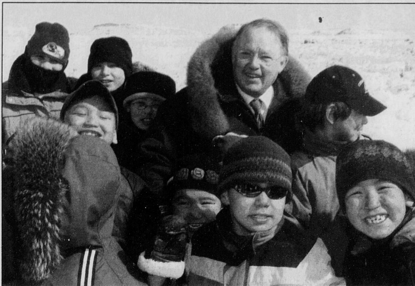
Le premier ministre Bernard Landry a rapidement été entouré de jeunes enfants inuits, hier, lors d'une promenade près de la baie de Tasiujaq, au Nunavik.

M. Caillé a aussi précisé que ce montant incluait les coûts de branchement des communautés inuites du Nunavik au réseau de distribution. «Quand on ouvre un territoire à l'hy-