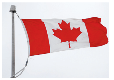
MATHIEU BÉLANGER REUTERS