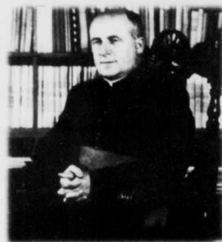
Dans ses ouvrages, Mgr Albert Tessier, un fils de Sainte-Anne-de-la-Pérade, a souvent parlé des petits poissons des chenaux.

Il dira plus loin que « le mot cabane est désuet : on commence à employer le terme " chalet ". Ce n'est pas une sinécure, au cours de cette période mouvementée, que de s'occuper de 35 cabanes dont quelques-unes peuvent recevoir 15 pêcheurs à la fois. Pour les amateurs de statistiques, chaque cabane laisserait au cours de cette courte période, un minimum de 50 $ si on ajoute les dépenses des quelque 100 000 visiteurs et plus, on pourrait penser qu'il se laisserait à La Pérade 300 000 $ à 500 000 $. Mais ces sta-