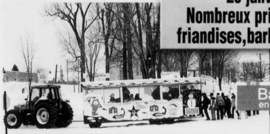
Balade gratuite en tramway sur la rivière