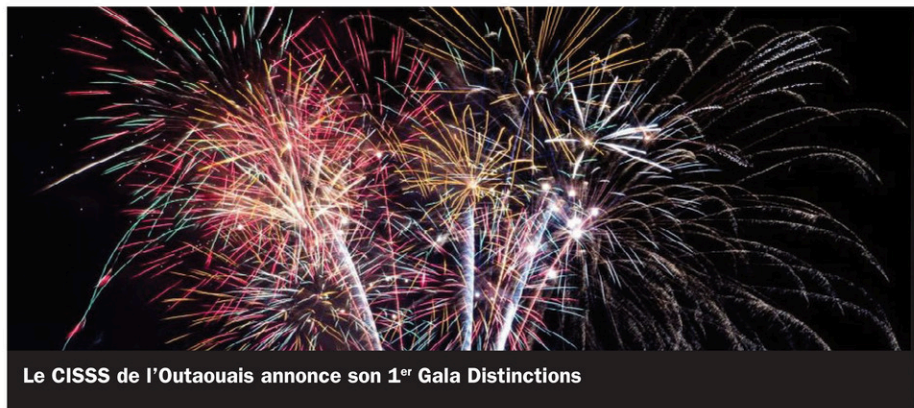
Le CISSS de l'Outaouais annonce son 1 er Gala Distinctions