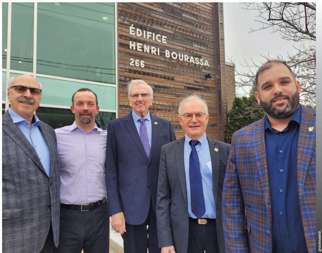
Les membres de l'Alliance.

Les membres de la coalition soulignent la vocation de villégiature de Petite Nation, notamment Lac-Simon et Duhamel. Et pour maintenir une qualité de vie équivalente pour les villégiateurs, elle compte bien défendre son territoire face au projet minier, notamment la qualité de l'eau, la biodiversité et la protection des terres publiques adjacentes aux terrains municipaux.