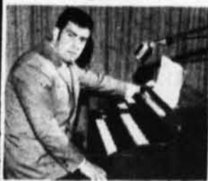
Pianiste - Organiste