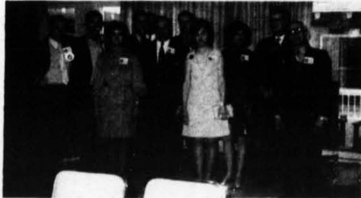
Les délégués du Comté de Papineau au Congrès Libéral.