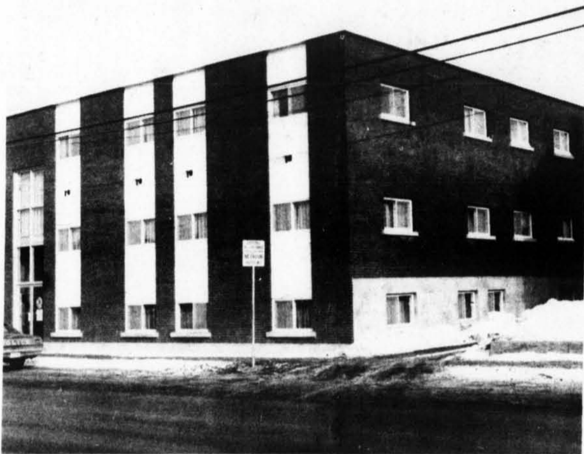
Ici nous voyons une photo du nouvel édifice à bureaux situés au 390 de la rue Principale à Buckingham. Si de l'extérieur le coup d'oeil est favorable, on nous dit que l'intérieur est sobre, mais également de belle apparence.