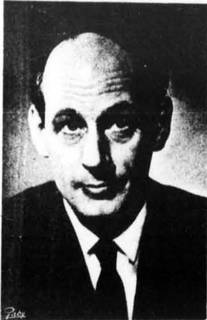
M. RENÉ LÉVESQUE