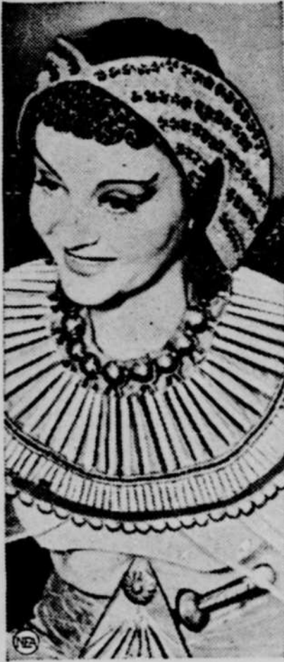
• Tallulah Bankhead jouait le rôle de Cléopâtre dans la pièce "Antoine et Cléopâtre", dont la première eut lieu à Rochester. Tallulah est sans contredit une Cléopâtre très jolie.

UN OFFICIER DE L'AVIATION ALLEMANDE VISITE L'ANGLETERRE