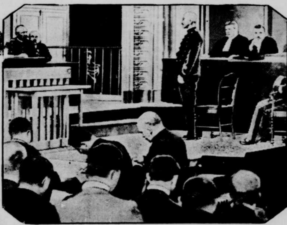
• DREYFUS à son premier procès, quand il fut trouvé coupable d'avoir vendu des secrets militaires à l'Allemagne et fut condamné à la déportation dans l'île du Diable.