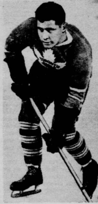
• Après une période d'entraînement particulièrement brillante, les différentes équipes de la Ligue Nationale de Hockey ont ouvert une autre campagne. Le 4 novembre dernier, les sportifs ont assisté à l'ouverture de la nouvelle saison. Quelques joueurs ont attiré l'attention, au cours de la dernière saison. On voit ici, à gauche, Larry Aurie, aile droite des Red Wings de Detroit, les champions de la dernière campagne. Au centre, une scène qui ne se présente pas souvent au cours d'une joute de goret. A l'extrême droite, Harvey "Busher" Jackson, aile gauche des Leafs de Toronto. Aurie et Jackson sont peut-être actuellement les meilleurs joueurs de toute la N. H. L.