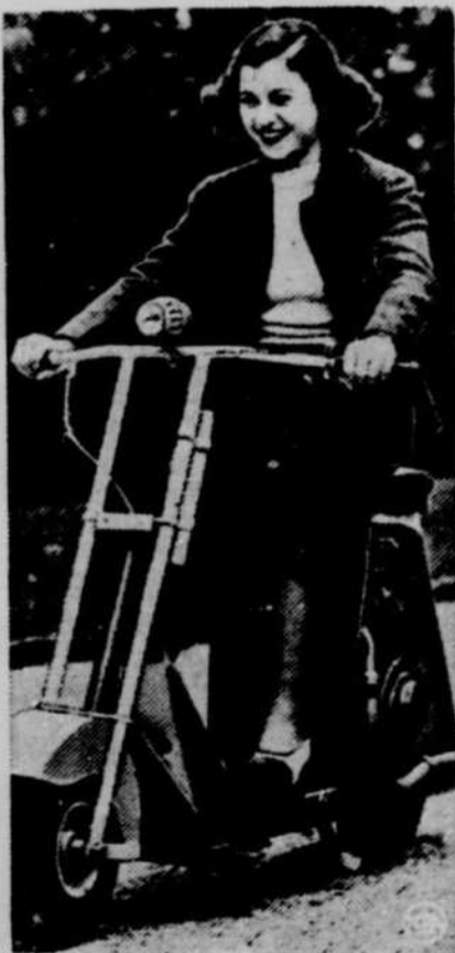
• Cette étudiante se rend au collège Notre-Dame du Bon Conseil de White Plains, N.Y. sur cette nouvelle bicyclette à moteur.