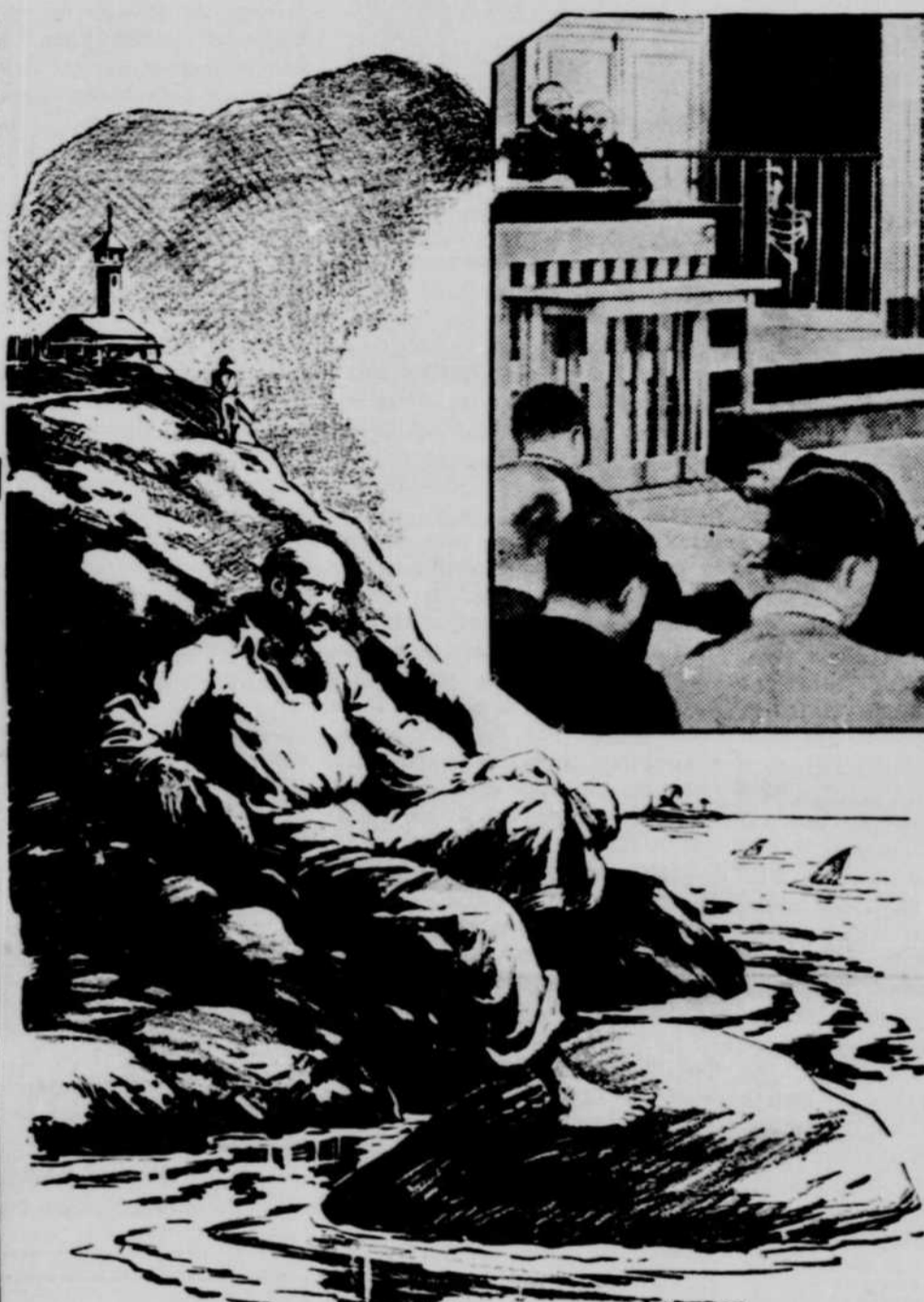
• DREYFUS allait s'asseoir pendant des heures sur les rochers bordant la mer infestée de requins, les regards tournés vers l'est comme s'il pouvait voir au loin, la France, sa femme et ses enfants.

Le souvenir doit, sans doute, être encore bien vivant dans l'esprit de ce loyal défenseur de la bonne cause. Il avait vécu sa jeunesse pendant les jours de la fameuse "Acaire" et c'est ce qui a donné naissance à sa carrière politi-