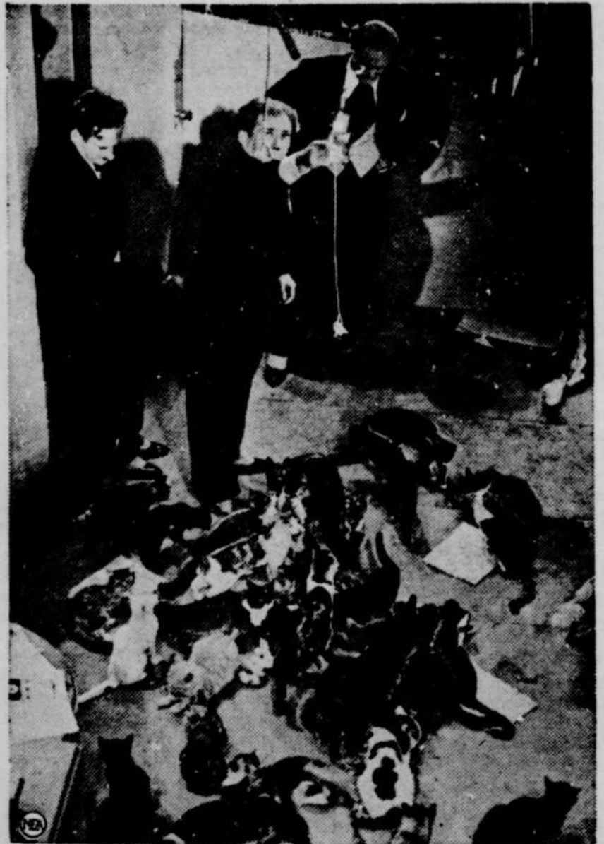
• Il fallut 300 chats et les Frères Ritz pour tourner cette scène appelée "Pussy Pussy". Tous les chats de Hollywood furent requis. Les petits garçons recevaient cinquante cents pour chaque chat qu'ils apportaient.