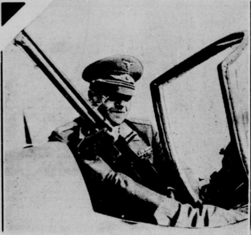
• Le général Milch, Secrétaire du ministère de l'aviation en Allemagne, visite les camps d'aviation anglais. Il visita ceux de la France récemment.

UN OFFICIER DE L'AVIATION ALLEMANDE VISITE L'ANGLETERRE