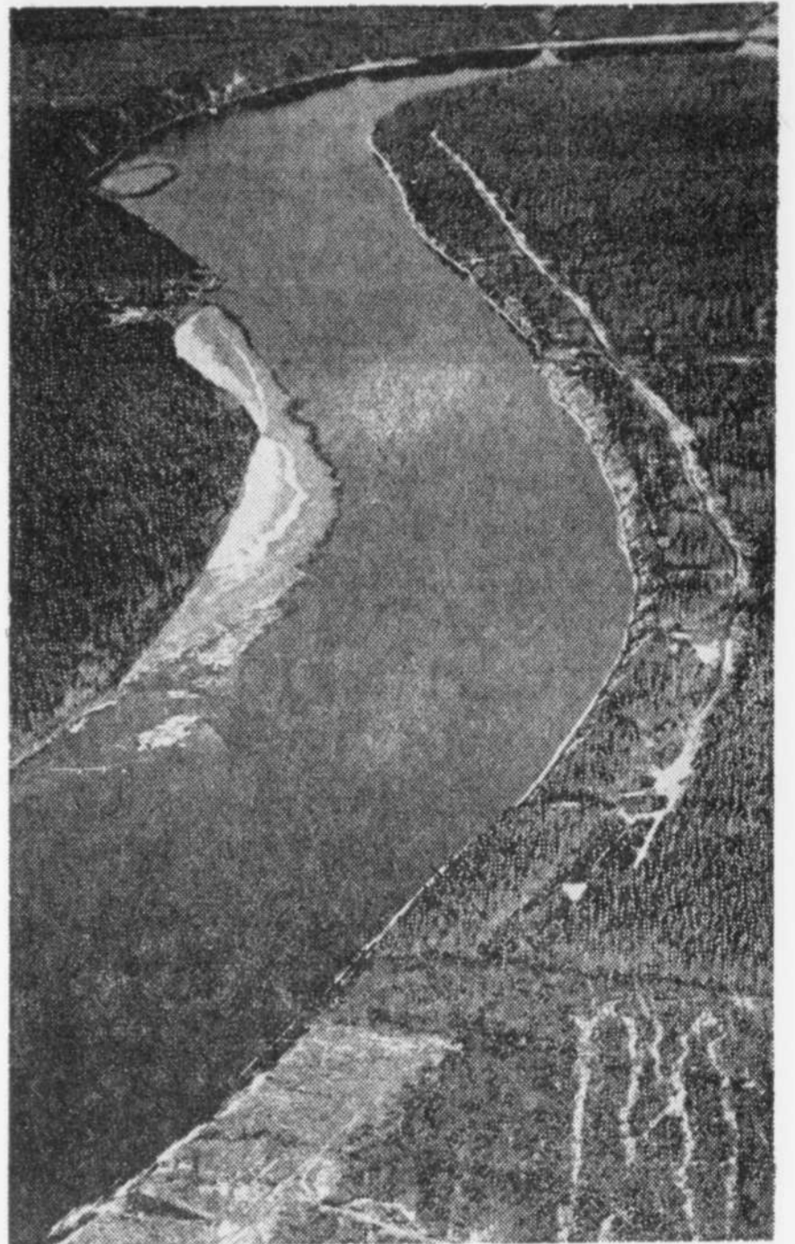
L'une des rivières à saumon que des pêcheurs veulent préserver.

Notons que la rivière Moisie, pratiquement un fleuve, est réputée comme étant l'une des plus belles rivières à saumon de l'Amérique.