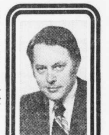
La Caisse d'entraide économique de Ste-Foy a le plaisir d'annoncer que monsieur Bernard Landry, ministre d'Etat au Développement économique, sera le conférencier invité lors de son premier dîner d'affaires pour la saison 1978-79, mardi le 12 septembre à 12h15, au Restaurant Le Cellier Inc. (Motel Universel), 2300, Chemin Ste-Foy, Ste-Foy. Il serait apprécié que ceux et celles qui désirent participer à ce dîner d'affaires, dont le sujet sera "Le Développement économique régional", communiquent au bureau de la Caisse, à 653-1660.

ration des caisses d'entraide économique du Québec était la seule fédération du groupe à ne pas faire partie du Conseil de la coopération du Québec.