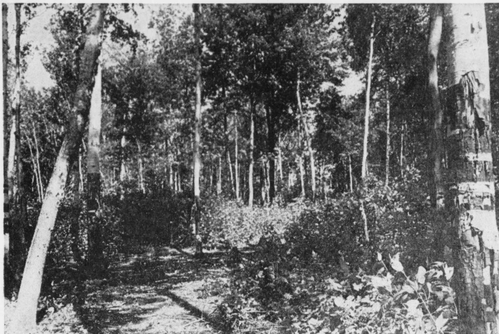
Le Soleil, Jean Vallières

Pour plusieurs Charlesbourgeois, une marche de santé dans les sentiers boisés de la montagne des roches vaut de l'or. Ce qui explique leur opiniâtreté à vouloir conserver cet espace à des fins récréatives.