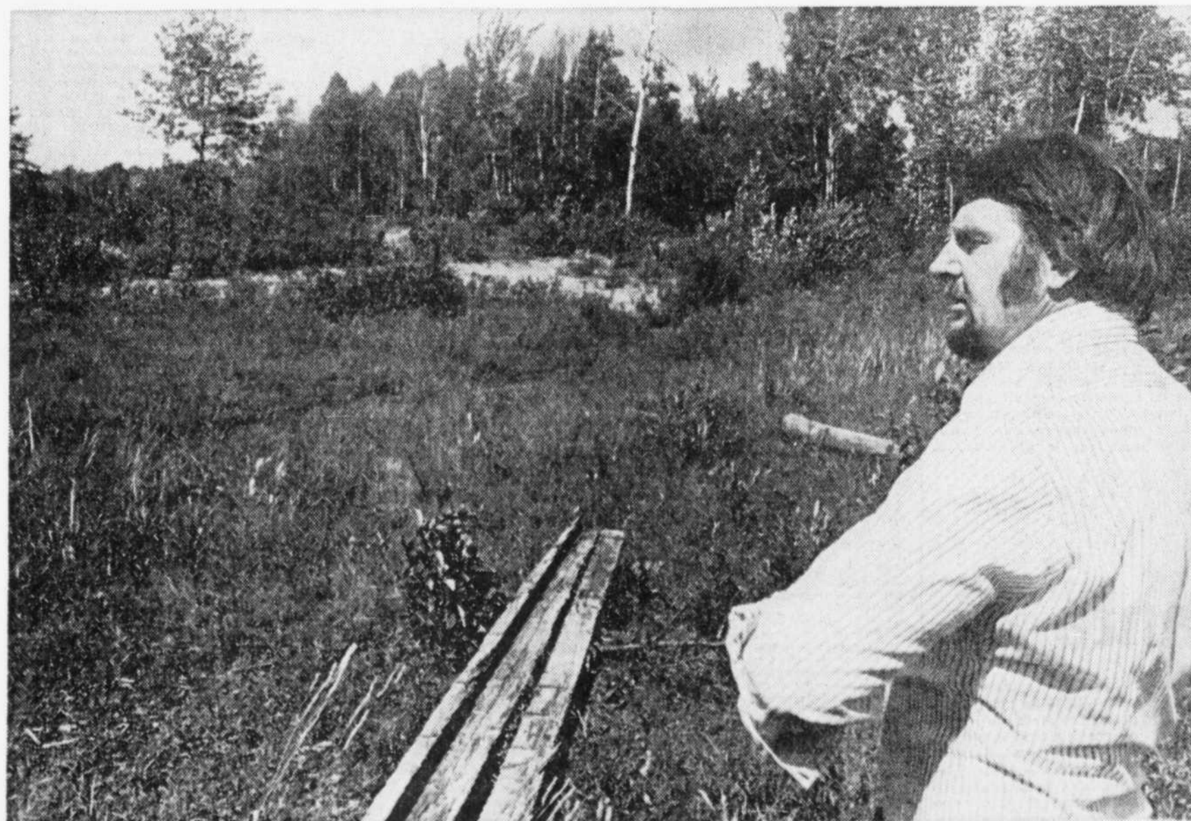
Le Soleil, Jean Vallières

Car, selon un calcul, la population de Charlesbourg bénéficierait actuellement de 402 acres d'aménagement, ce qui signifie un déficit de 798 acres.