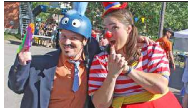
L'Agent Smat et Pakane La Clown.

Gala méritas 2018 de l'école secondaire De Rochebelle