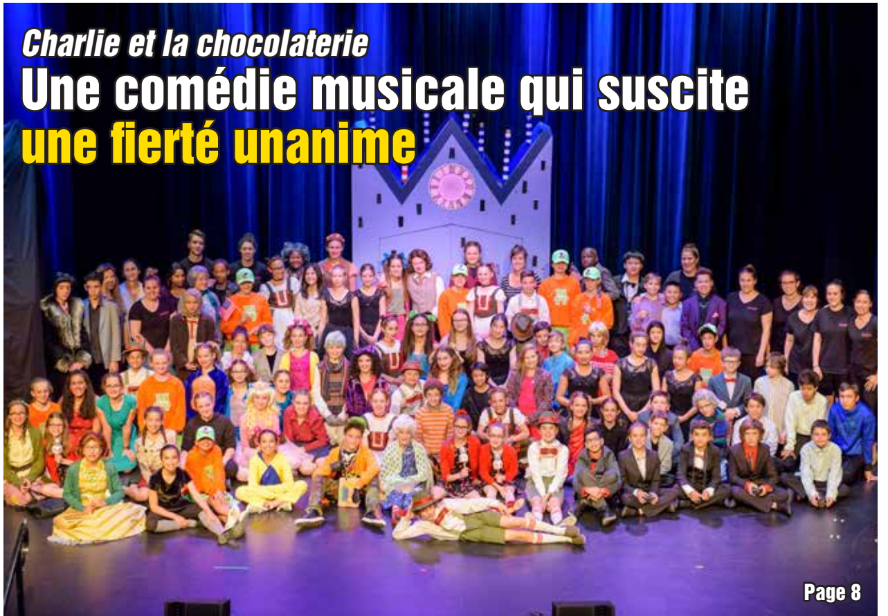
Charlie et la chocolaterie Une comédie musicale qui suscite une fierté unanime