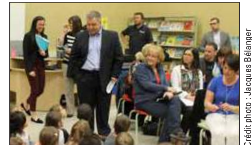
Le ministre de l'Éducation, du Loisir et du Sport et ministre responsable de la région de la Capitale-Nationale, M. Sébastien Proulx, accueilli par des enfants de l'école Sainte-Geneviève.

Des agents de transition seront ajoutés dans chaque commission scolaire et un nouveau programme permettant d'arrimer ceux des enfants de quatre et cinq ans sera mis à l'essai dans environ 40 classes. « Au total, ce sera plus de 400 classes qui seront touchées par cette mesure », précise le ministre Proulx. Ce dernier a également