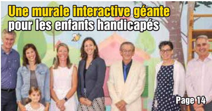
Une murale interactive géante pour les enfants handicapés