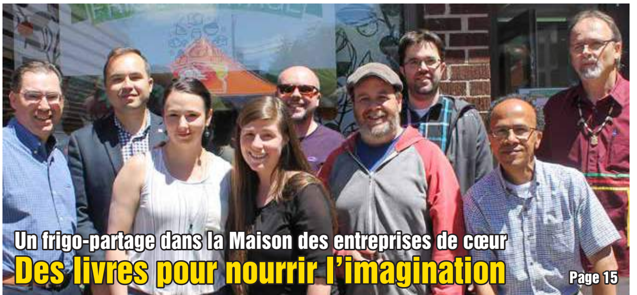
Un frigo-partage dans la Maison des entreprises de cœur Des livres pour nourrir l'imagination