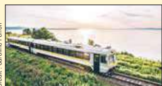
Le Train de Charlevoix