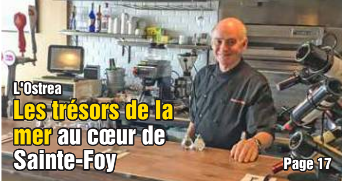
L'Ostrea Les trésors de la mer au cœur de Sainte-Foy