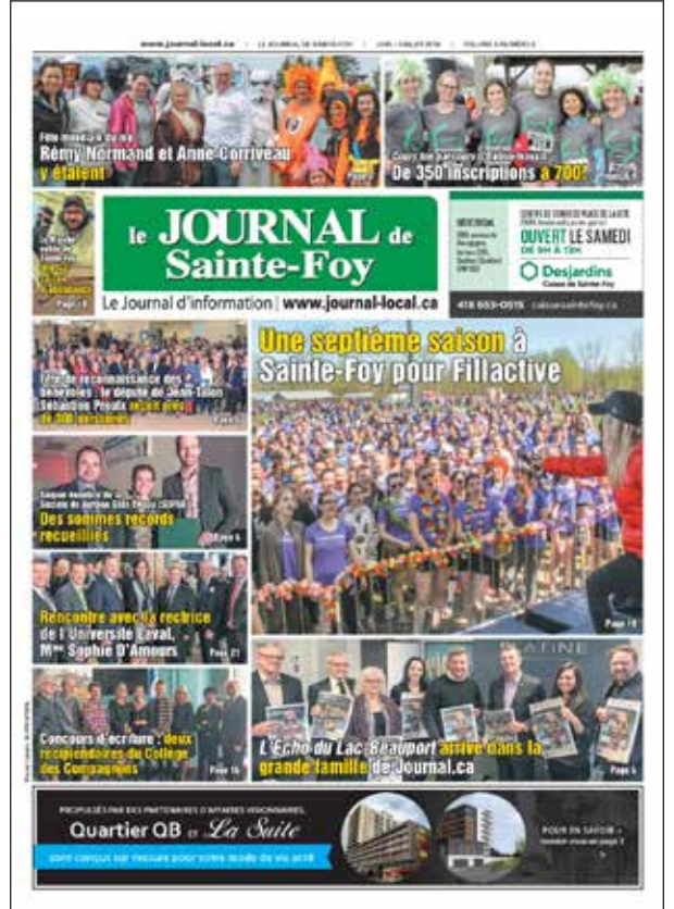
Dernière édition du Journal de Sainte-Foy.

Le mardi 21 août, Journal.ca tiendra une rencontre avec des organismes de la région de Québec afin de saluer leur engagement et leur générosité. ■