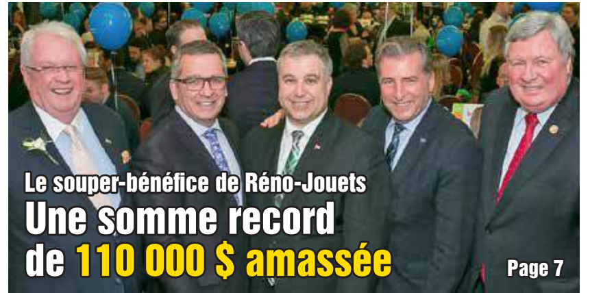
Le souper-bénéfice de Réno-Jouets Une somme record de 110 000 $ amassée