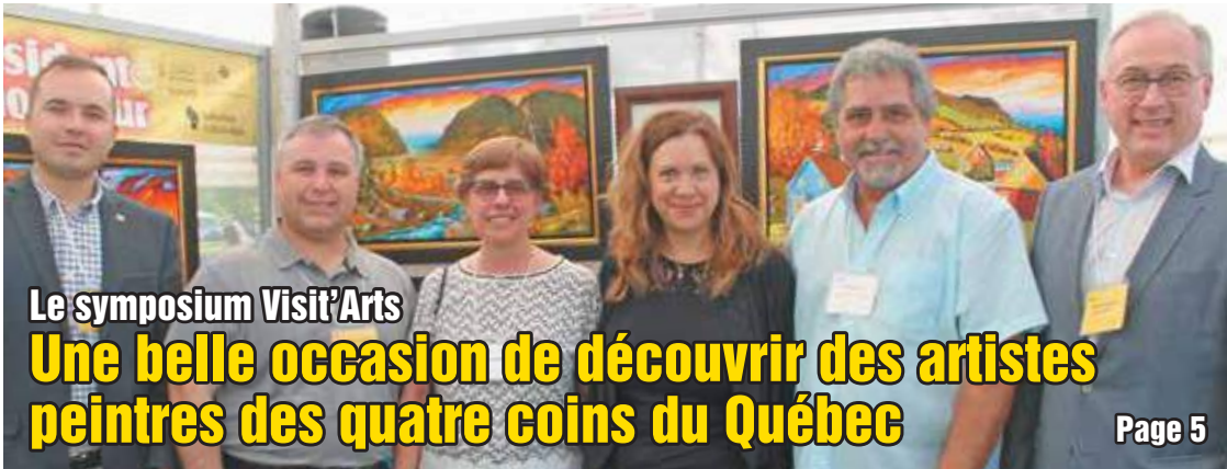
Le symposium Visit'Arts Une belle occasion de découvrir des artistes peintres des quatre coins du Québec