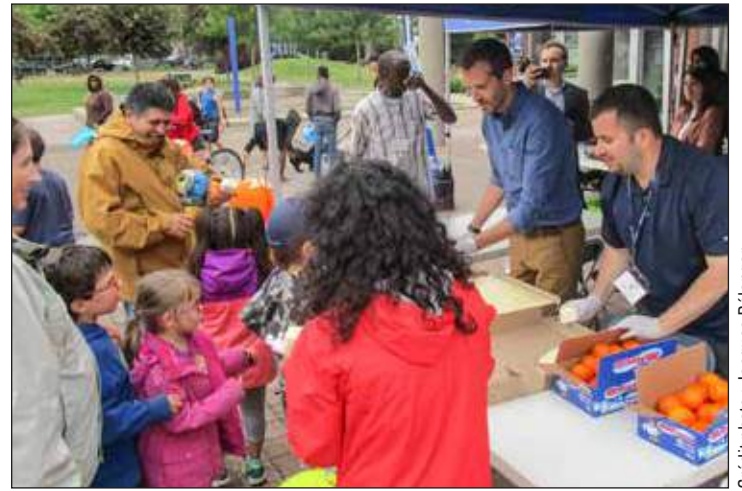
Une Saint-Jean sans le traditionnel gâteau ne serait pas vraiment festive. Le député fédéral de Louis-Hébert et secrétaire parlementaire du ministre des Finances, Joël Lightbound, a bravé le temps maussade pour offrir des parts de pâtisserie qui ont trouvé preneurs.