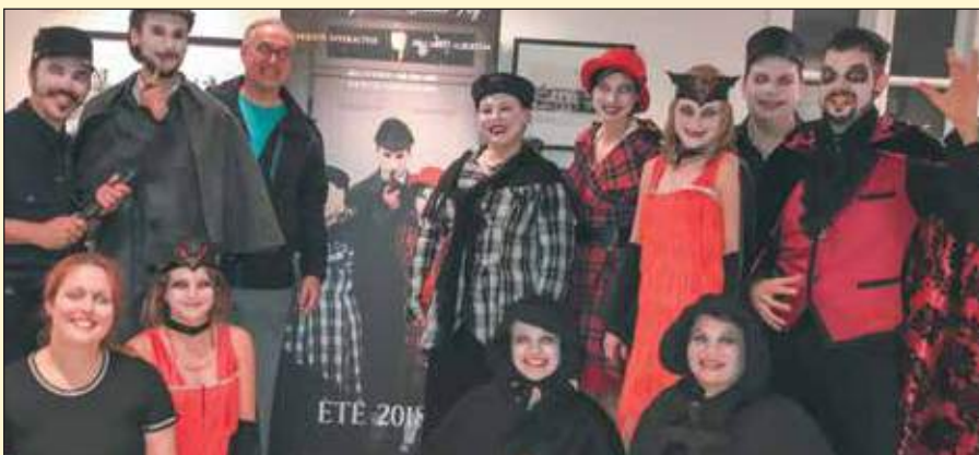
Sur la photographie, au centre, on peut voir le conseiller du district du Plateau et président de l'arrondissement du Plateau, Rémy Normand, en compagnie de la troupe des Comédiens sans bagage.

Le site de la Visitation a été dernièrement l'objet d'une enquête interactive mettant en scène la troupe des Comédiens sans bagage lors d'une représentation de l'enquête interactive de Sherlock Holmes – Le Vampire de Sainte-Foy. ■