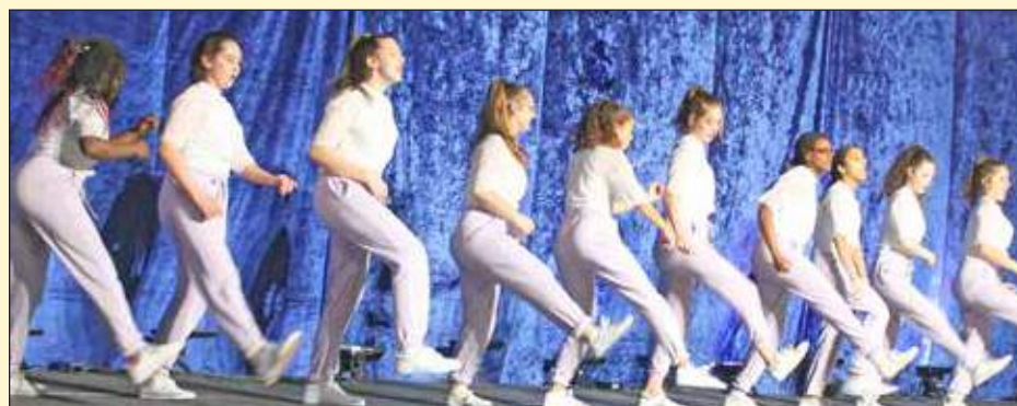
La troupe Worries, durant son numéro.