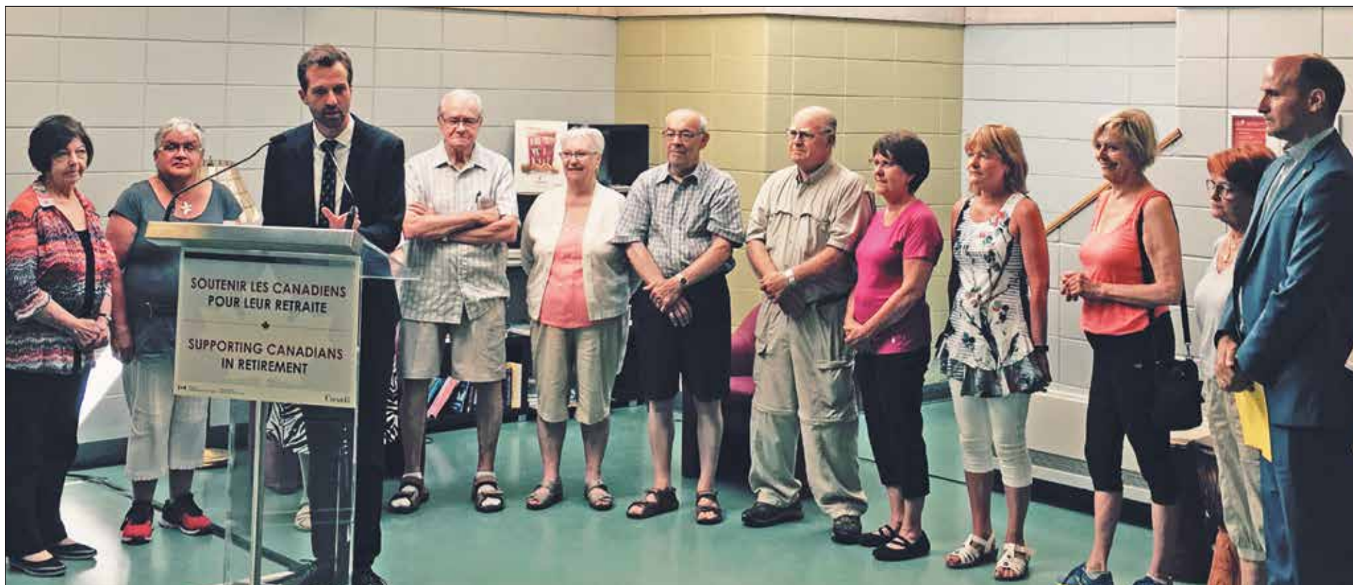
Conjointement, Joël Lightbound et Jean-Yves Duclos ont présenté des nouvelles mesures afin de soutenir les Canadiens dans leur retraite.