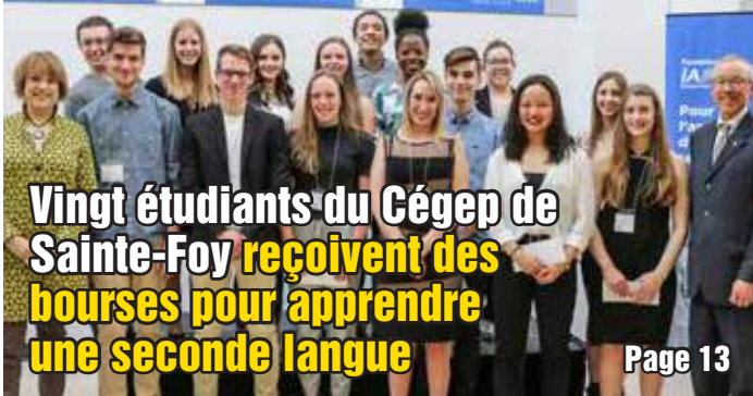
Vingt étudiants du Cégep de Sainte-Foy reçoivent des bourses pour apprendre une seconde langue