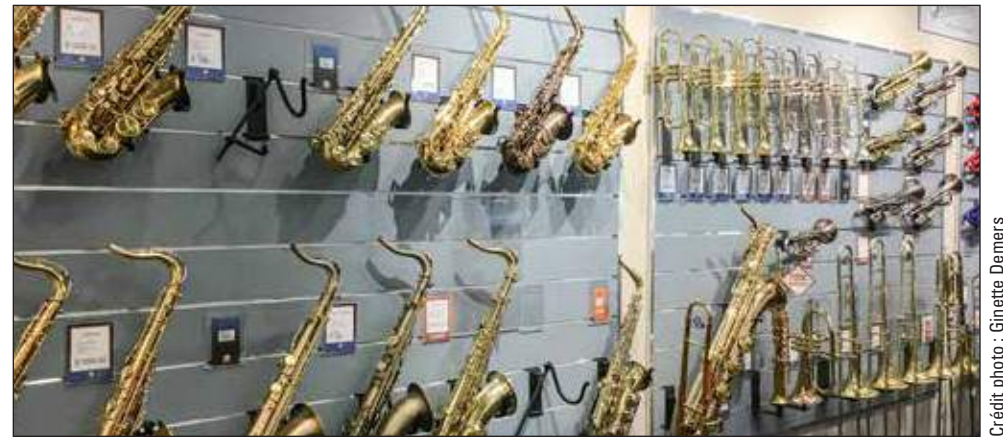
Long & McQuade accorde une grande importance aux divers modèles d'instruments, dont les saxophones.