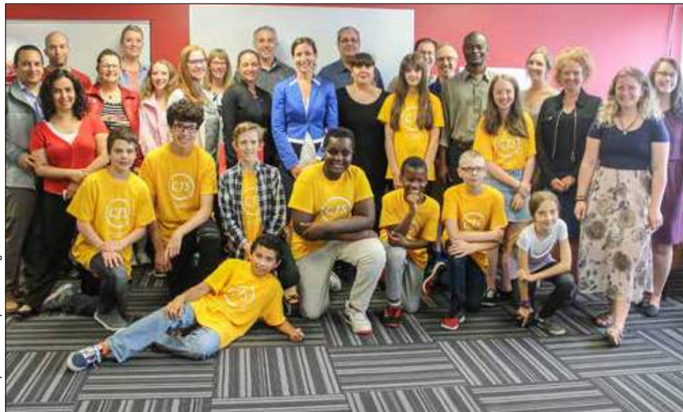
Photographie réunissant les participants, les organisateurs et les partenaires du projet.

Rappelons de la CJS de l'Ouest dessert maintenant les territoires de Sainte-Foy, Sillery, Cap-Rouge, L'Ancienne-Lorette et Saint-Augustin-de-Desmaures et offre des services depuis le mois de juillet jusqu'à la mi-août. ■