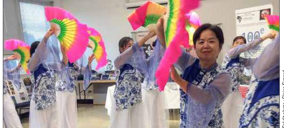
On a profité de la soirée pour y aller d'une note festive par le biais de spectacles de danse.