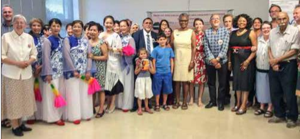
Une partie de l'assistance venue célébrer le centenaire de Nelson Mandela.

communication publique et membre du groupe de recherche sur les mutations du journalisme, était un militant en faveur des droits de la personne avant de devenir vice-recteur de l'Université Nelson Mandela d'Haïti. Il a entretenu l'auditoire sur le cheminement parsemé d'embûches de Nelson Mandela et de la façon de les détourner en s'appuyant sur le dialogue, le respect et la diversité d'opinion. ■