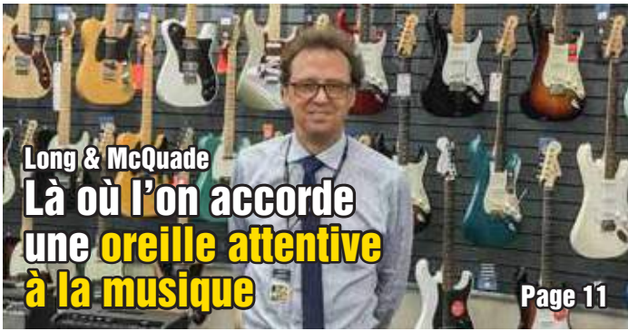
Long & McQuade Là où l'on accorde une oreille attentive à la musique