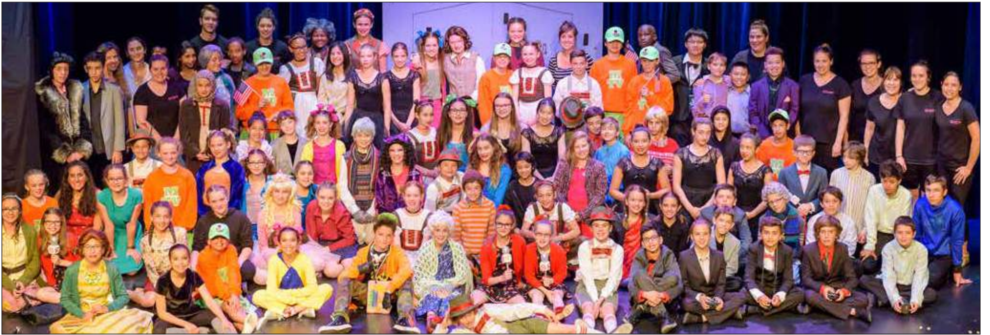
L'ensemble de la troupe de finissants et finissantes de l'école d'éducation internationale Filteau qui a participé à la comédie musicale Charlie et la chocolaterie , présentée au Théâtre de la Cité universitaire.