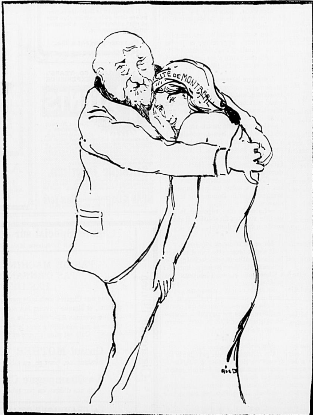
Le vieil échevin—Ma chère vieille Cité, que je t'aime! Que deviendrais-tu sans moi? La Belle à Mandat.—Tu me fais peur avec ton amour subit, tu m'étouffe!!!

BUREAU ET IMPRIMERIE : 105 A 109 RUE ONTARIO EST, MONTRÉAL