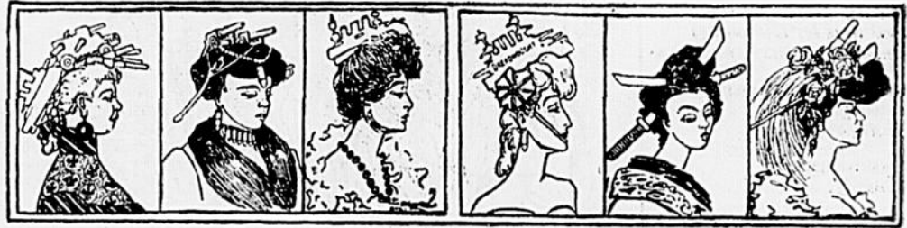
Dernières créations dramatiques comme coiffures de scène.