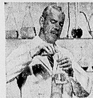
Seul BRISK de Colgate contient le Fluorure/85

ces ingrédients caractéristiques atteignent le plus grand avancement possible jamais offert par un dentifrice... et fourni seulement par Brisk, pâte dentifrice au fluorure.