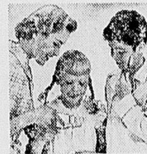
Fait ressortir la blancheur naturelle des dents