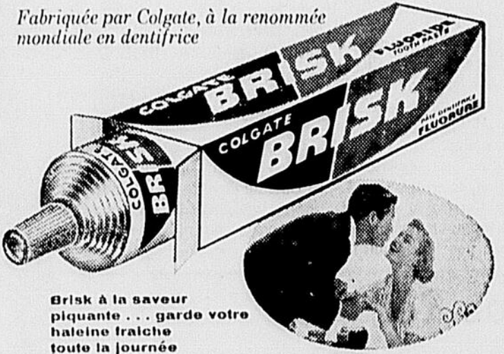
Brisk à la saveur piquante... garde votre haleine fraîche toute la journée