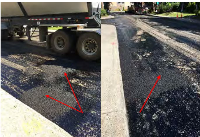
Emrobés bitumineux non-compactés

Bien que les corrections des défauts aient été effectuées, le Bureau de l'inspecteur général a observé sur un (1) chantier qu'il n'y a eu aucune compaction de l'enrobé par rouleau pour obtenir le degré de compaction exigé au devis. Le surveillant étant absent, il n'a pas pu vérifier si le bon mélange a été utilisé.