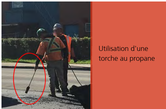
Utilisation d'une torche au propane

Le surveillant a accepté la réparation d'un défaut de joint froid en utilisant une torche à propane au lieu de l'adhésif exigé au devis.