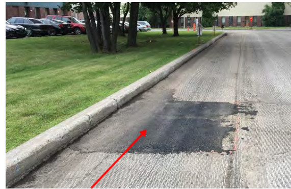
Correction d'un défaut ponctuel réalisée selon les exigences du devis

Les chargés d'enquête du Bureau de l'inspecteur général ont constaté sur plusieurs chantiers que les surveillants manquaient de rigueur et n'assumaient pas pleinement leur rôle dans la réparation des défauts.