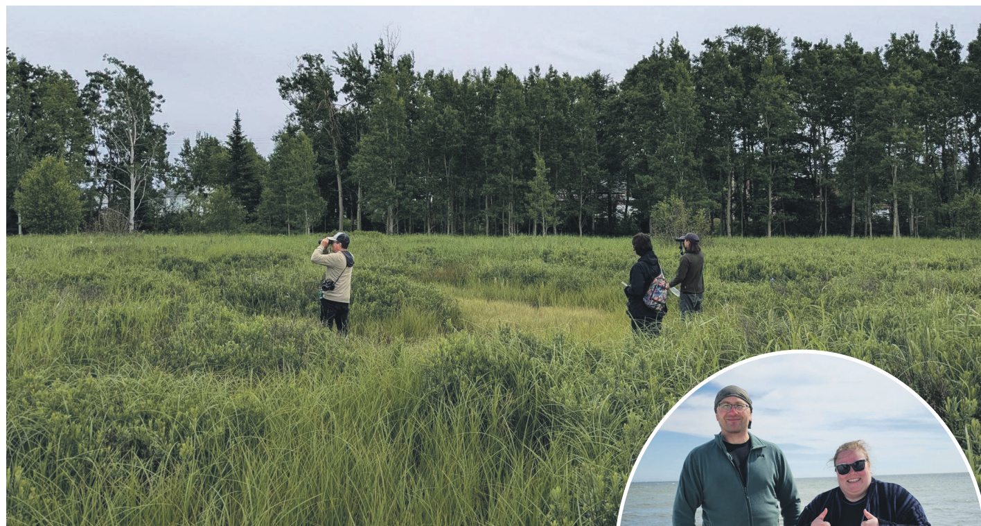
Le Comité ZIP de la rive nord de l'Estuaire est voué à la protection, à la restauration et à la mise en valeur du fleuve Saint-Laurent sur la Haute-Côte-Nord et dans la Manicouagan.

nisme occupait une place stratégique dans la concertation régionale en matière d'environnement. Il intervenait notamment dans la protection et la restauration des habitats côtiers, la lutte contre l'érosion des berges et la sensibilisation du public.