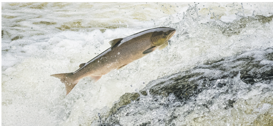
Des suivis de populations ont permis de constater qu'il y avait une bonne présence de saumons atlantiques juvéniles dans la rivière.

« Ça se peut que les travaux viennent bonifier la quantité de juvéniles dans le temps, donc là-dessus on est confiants », ajoute-t-il.