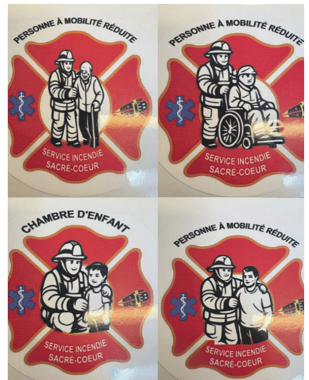
Différents autocollants sont disponibles selon les situations des citoyens concernés.

Elle ajoute que ces permis sont gratuits et qu'ils empêchent les feux à ciel ouvert lors des interdictions émises par la SOPFEU.