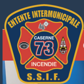
CASERNE 73 PORTNEUF-SUR-MER