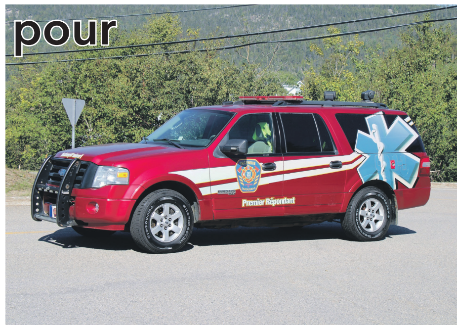
Des visites à domicile sont prévues par le service de protection des incendies de la municipalité de Tadoussac.

D'après Robin Lepage, les intoxications au monoxyde de carbone surviennent principalement en raison d'une méconnaissance, d'une mauvaise utilisation ou d'un mauvais entretien des appareils.