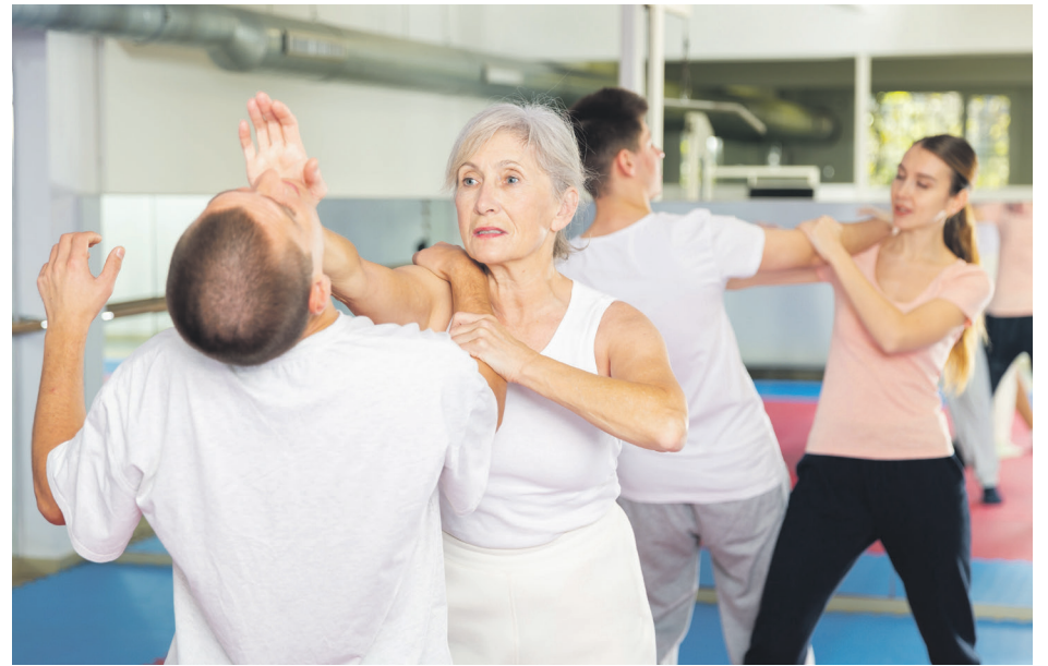
Les ateliers s'adressent généralement aux participantes de 14 ou 16 ans et plus, selon les groupes, et se déroulent sur une journée complète d'environ sept heures.

Sur la Côte-Nord, la tournée de mai passera notamment par Sacré-Cœur, Forestville, Pessamit et Baie-Comeau.