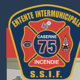
CASERNE 75-76 COLOMBIER