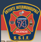
CASERNE 74 FORESTVILLE