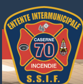
CASERNE 70 LES ESCOUMINS