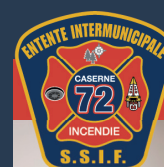
CASERNE 71-72 LONGUE-RIVE