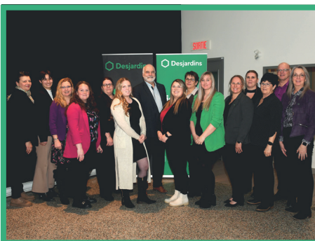
Une grande partie des employés de la Caisse étaient présents lors de l'assemblée générale annuelle de la Caisse