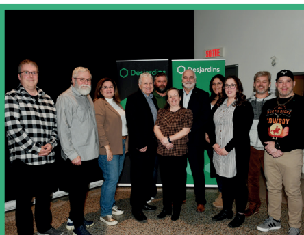
Les membres du conseil d'administration et les administrateurs sortants, soulignés pour leur engagement.