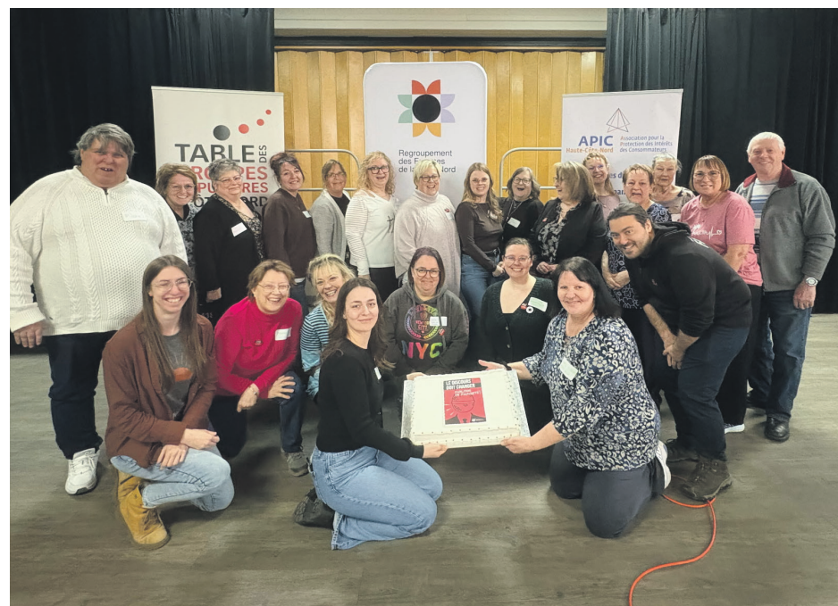
Une vingtaine de participants ont pris part à la journée Parlons de pauvreté.

Les témoignages et revendications recueillis lors de cette tournée alimenteront les demandes qui seront portées sur la scène nationale en vue des élections de 2026. Le processus culminera lors d'un grand rassemblement prévu les 22 et 23 mai à Québec.