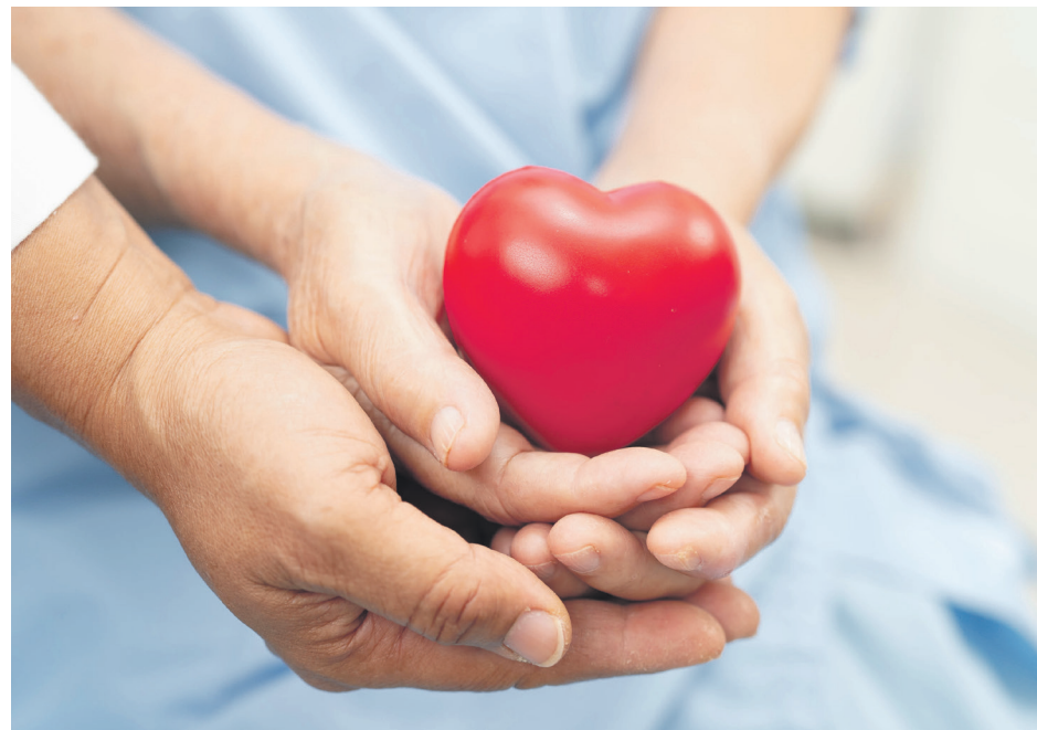
Chaque donneur d'organes peut sauver jusqu'à huit vies et améliorer la qualité de vie de plusieurs autres grâce au don de tissus.

Au 31 décembre, six personnes de la Côte-Nord étaient en attente d'une transplantation, un chiffre qui équivaut au nombre de transplantations réalisées pour des patients de la région en 2025. Les organes, eux, sont attribués à l'échelle provinciale, selon l'urgence et la compatibilité.