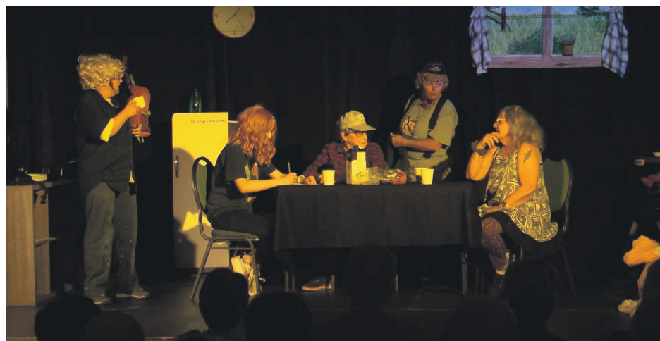
La pièce de théâtre sera présentée à la salle multifonctionnelle des Escoumins le 8 mai.

Avec ses 14 actrices âgées de 14 à 80 ans, ses thèmes sérieux et ses moments drôles, la pièce avait été bien appréciée lorsqu'elle a été présentée à Sacré-Cœur.