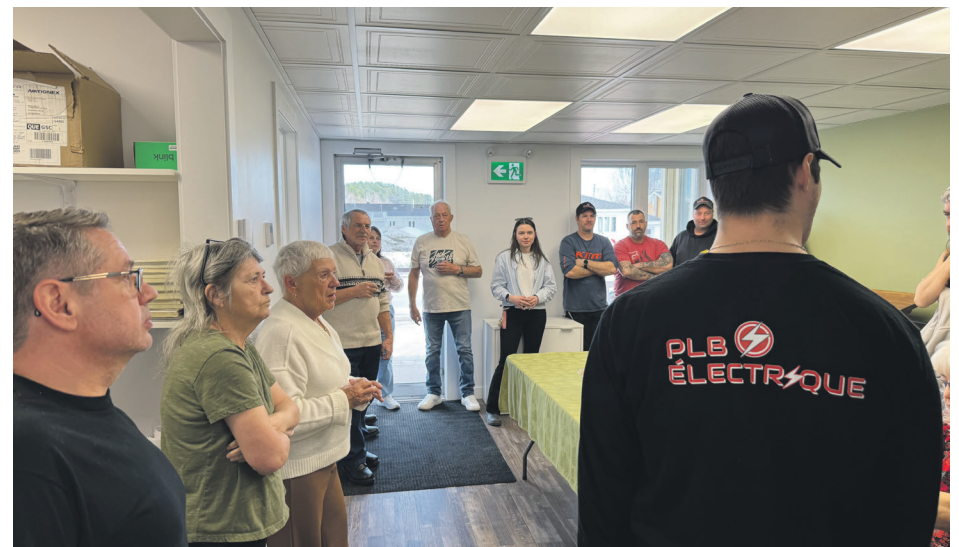
Les nouveaux bureaux sont mieux adaptés aux besoins de l'entreprise en électricité qui a été fondée en octobre 2020.

Malgré un carnet de commandes bien rempli, le principal défi demeure le recrutement de main-d'œuvre qua-