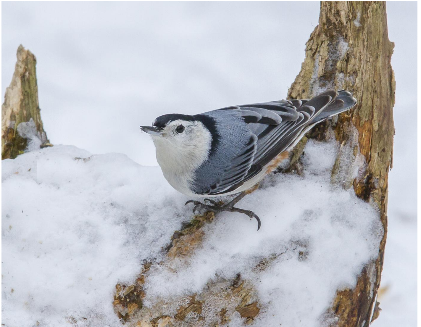
Sittelle à poitrine blanche