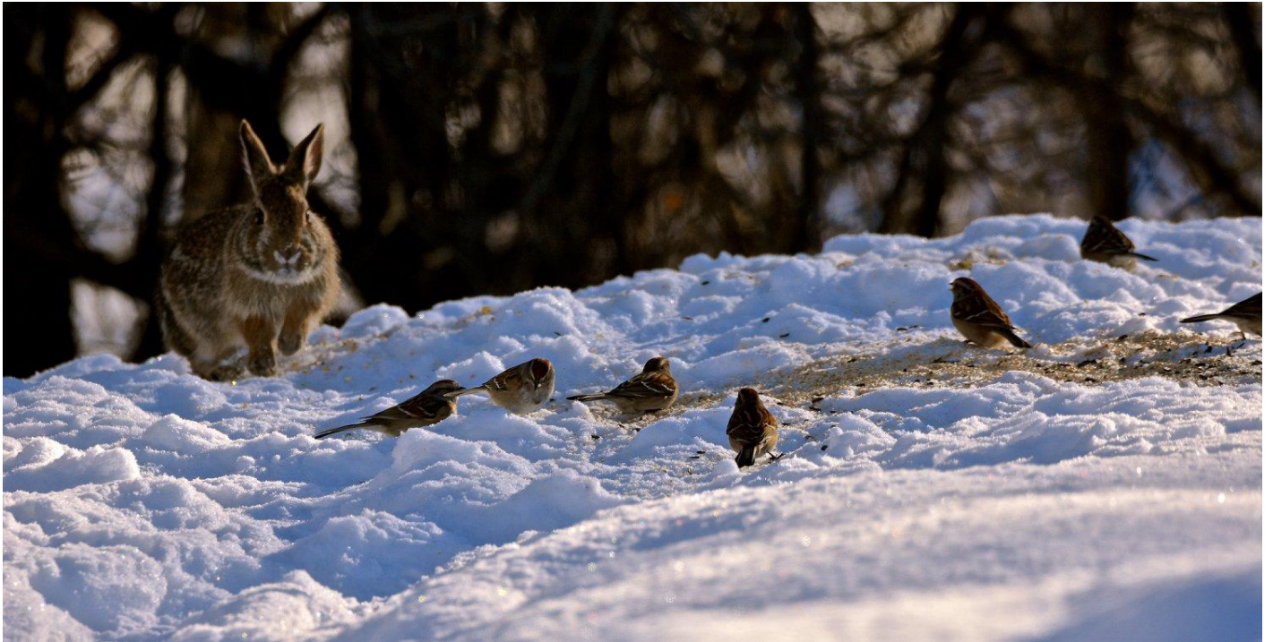
Bruants hudsoniens, Cimetière de Laval