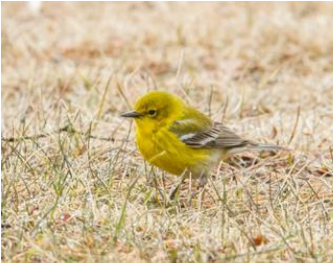
Paruline des pins (par D. Murphy)

Par la suite, j'ai observé les oiseaux, jusqu'au moment où j'ai dû partir au travail. Je pensais à plusieurs spectacles féériques et aux lieux naturels de toute beauté que j'ai vus grâce à l'ornithologie. Cette fois encore j'ai été très impressionné, mais ce ne fut pas spécifiquement par les oiseaux.