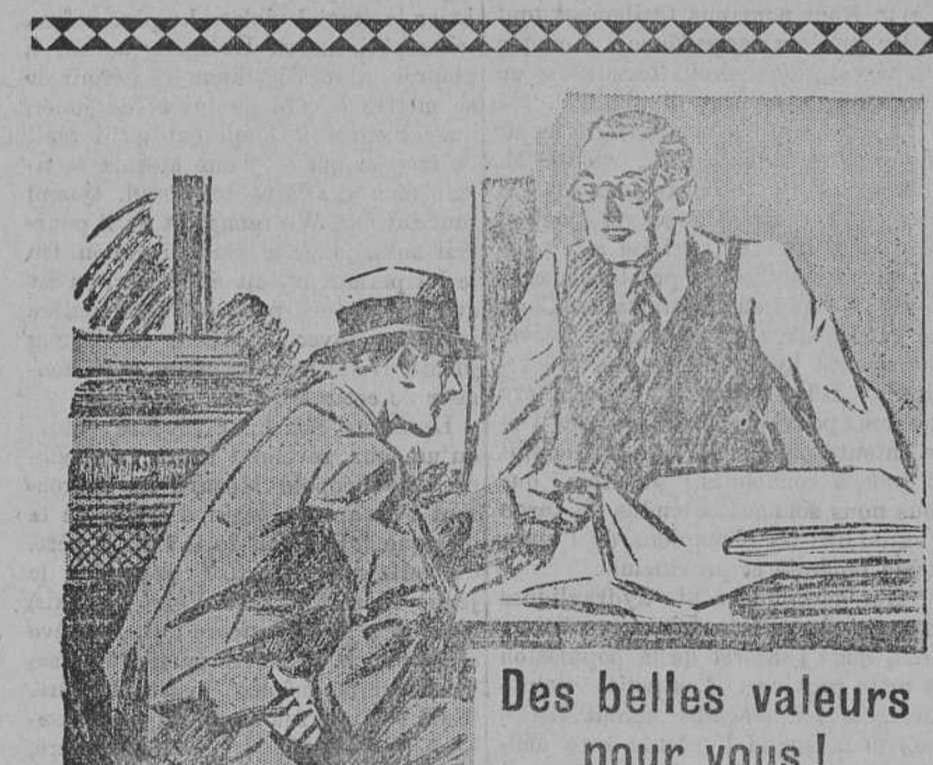
Des belles valeurs pour vous!

(Par ordre) LAMARCHE & BOUDREAULT Protonotaire de la cour supérieure district de Montcalm.