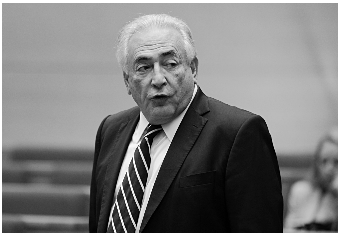
Dominique Strauss-Kahn lors d'une audience au Sénat français, en juin.

Les juges ont cependant abandonné la qualification criminelle de « bande organisée », qui aurait pu justifier un renvoi devant une cour d'assises. Ils ont finalement retenu l'infraction de « proxénétisme aggravé en réunion » à l'encontre de treize personnes, dont DSK, et celle de « complicité d'escroqueries et d'abus de biens so-