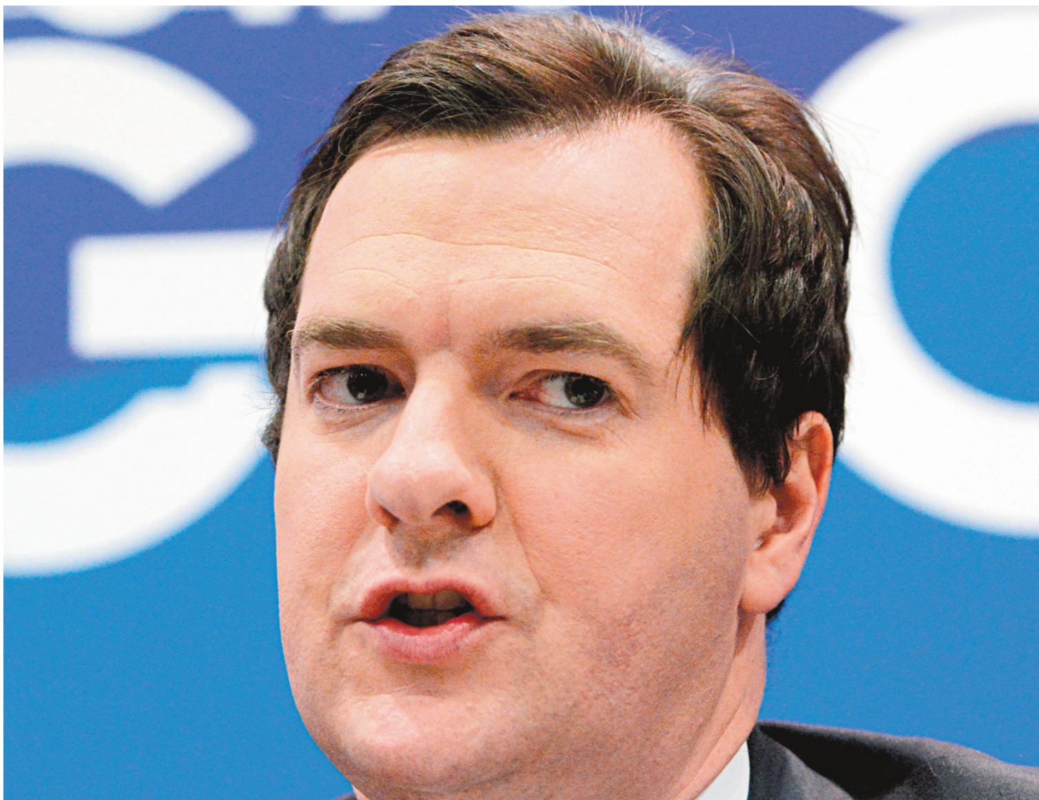
George Osborne, le chancelier de l'Échiquier, équivalent du ministre des Finances.