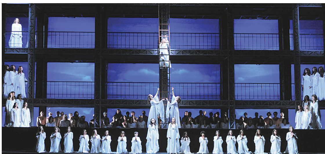
La scène où Marguerite monte une échelle pour gagner les cieux dans La damnation de Faust .