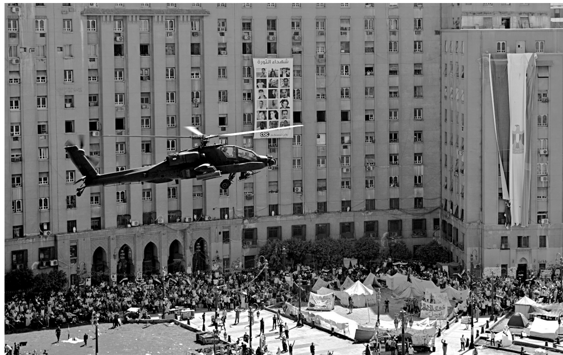
Cet hélicoptère de l'armée survolait vendredi les partisans du président déchu.

La foule brandissait des drapeaux égyptiens et des portraits du chef de l'armée, le général