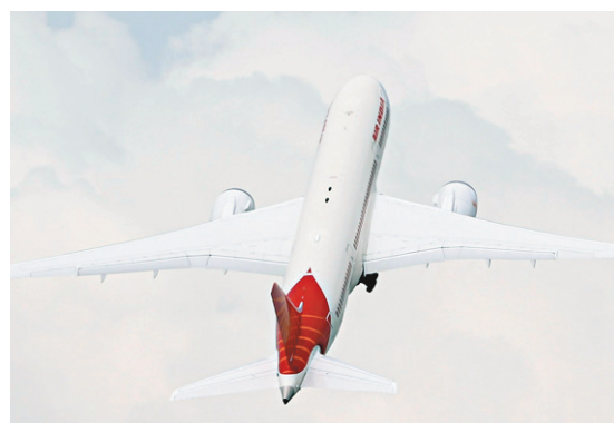
Essai au Salon du Bourget en juin dernier d'un Boeing 787 d'Air India

La japonaise All Nippon Airways (ANA) a annoncé pour sa part, toujours vendredi, avoir trouvé des batteries défectueuses sur deux baïonnettes de détresse de 787, une avarie soupçonnée