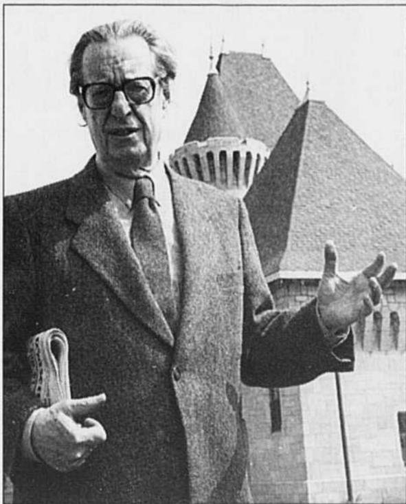
JEAN DION LE DEVOIR

Ils étaient 300 anglophones de Montréal, mardi soir, réunis à l'invitation d'Alliance Québec dans une petite salle d'un hôtel du centre-ville. Motif: la première de The Rise and Fall of English Montreal , une production de l'Office national du film. Un portrait sombre et résolument pessimiste de l'avenir de la minorité d'expression anglaise, qui suscite déjà un certain débat au sein même de la communauté. Avec le dernier film de William Weintraub, les anglophones de Montréal ont maintenant leur Disparaître .