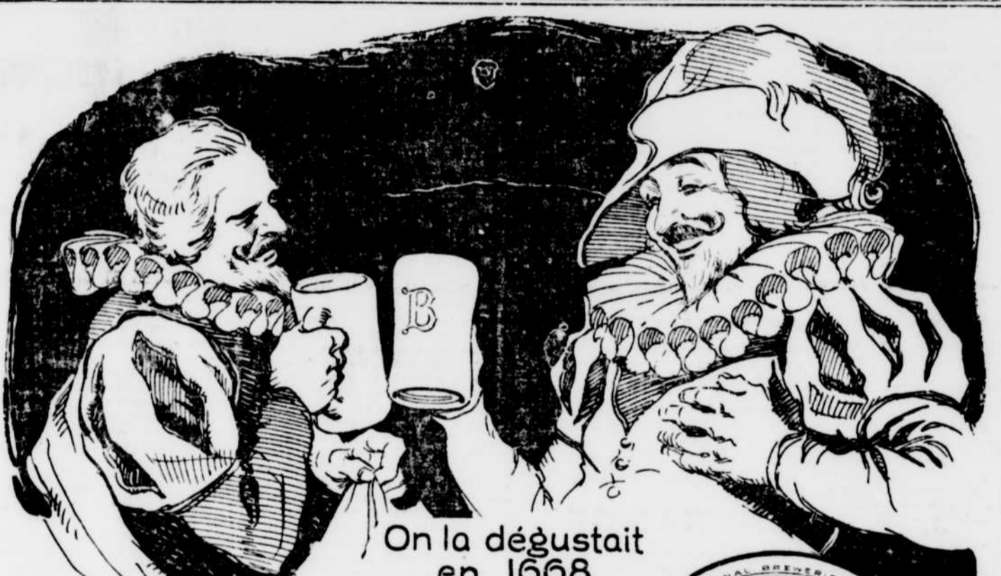
On la dégustait en 1668

de l'Agriculture l'a expliquée en quelques mots. Elle a un caractère connexe à la première. Depuis l'application étendue des lois de voirie, le gouvernement prête des sommes considérables aux municipalités. Il est naturel qu'il soit mis au courant de l'état financier de ces emprunteuses. A ces considérations, ajoutons celles qui ont trait au développement, plutôt rapide dans ces vingt dernières années, des affaires et des budgets des municipalités. Il ne s'agit plus de s'en rapporter, pour la tenue des livres, à un système d'absolu laisser-faire lorsque ce laisser-faire signifie inexpérience, négligence, et, en définitive, comptabilité incompréhensible. Le gouvernement cherche à améliorer tout cela, à la demande de ceux qui sont le plus directement intéressés. Sans commettre d'ingérence indue, il vient apporter son aide. C'est un geste aujourd'hui nécessaire. Il sera bien vu.