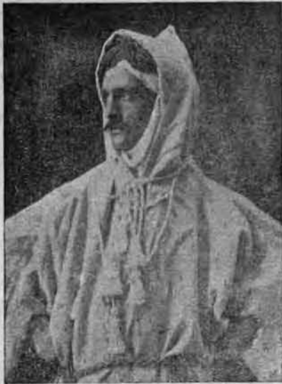
GASTON DE MONTIGNY , le soldat poète, qui vient de mourir. La vignette ci-dessus le représente en costume de Bédouin, alors qu'il servait la France, dans la Légion étrangère, sur les frontières du Sahara.

A. FASSIO Professeur de Solfège, Violon et Guitare. Arrangement de Musique, &c. No 1839, avenue Delormier, Montréal.