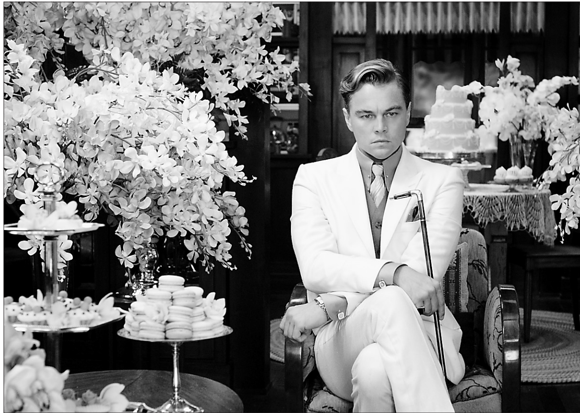
Leonardo DiCaprio incarne Jay Gatsby dans ce film flamboyant qu'est Gatsby le magnifique .

Beaucoup plus « incarnée » que la version trop lisse réalisée par Jack Clayton en 1974, dont la star était Robert Redford, The Great Gatsby ( Gatsby le magnifique en version française) mise davantage sur une question existentielle cette fois. L'enjeu est en effet moins ici de savoir comment ce nouveau nabab est devenu riche,