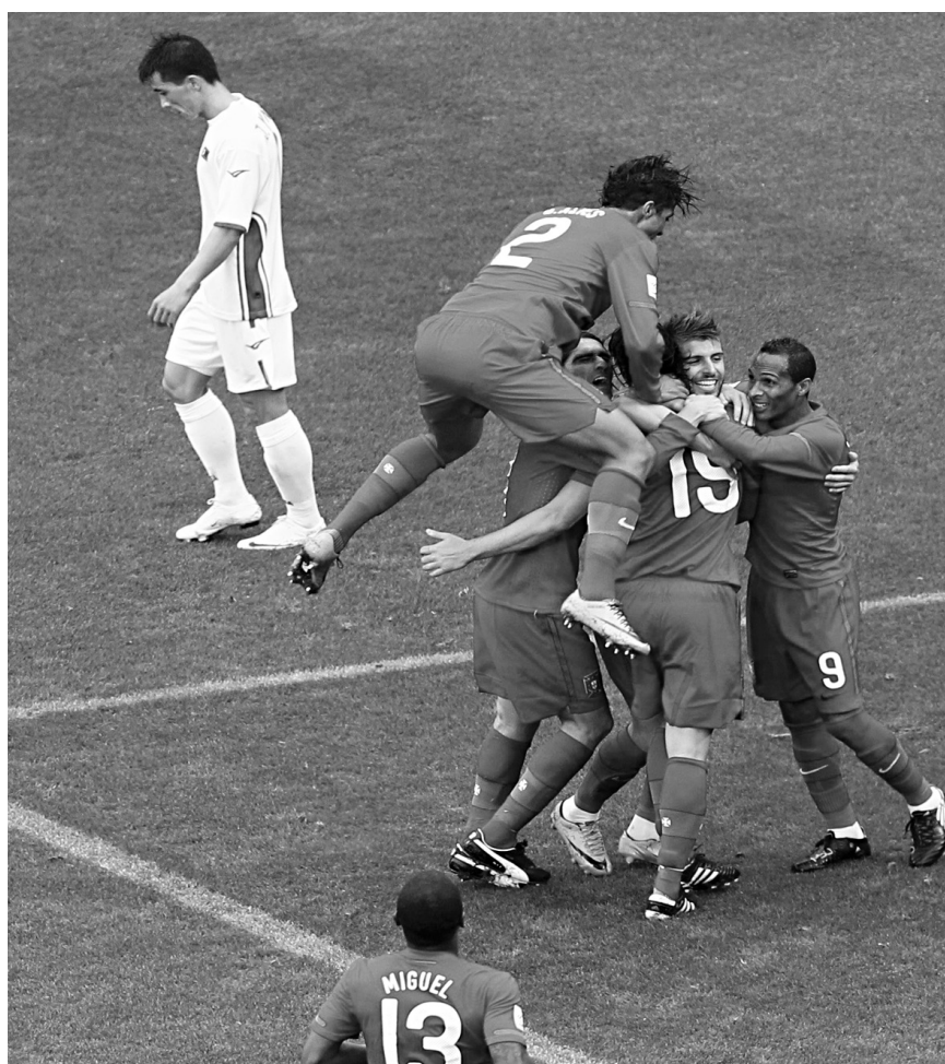
Le Portugal a remis sa campagne de la Coupe du monde sur les rails, hier, à l'aide d'une victoire de 7-0 contre la Corée du Nord dans un match du groupe G. Les Nord-Coréens ont le même coup été éliminés.

L'équipe qu'alignera Raymond Domenech face à l'Afrique du Sud pourrait être bien différente de celles formées au coup d'envoi des deux