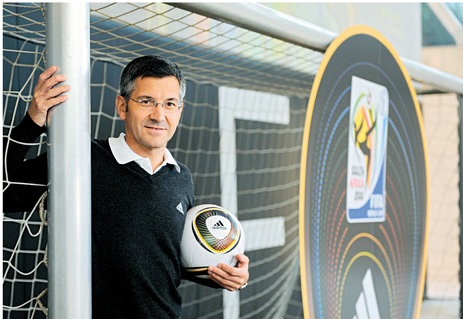
Le président d'Adidas, Herbert Hainer, tient le ballon officiel du Mondial 2010, le «Jabulani».