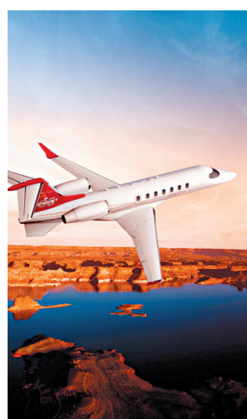
Maquette du futur jet d'affaires de Bombardier, le Learjet 85.