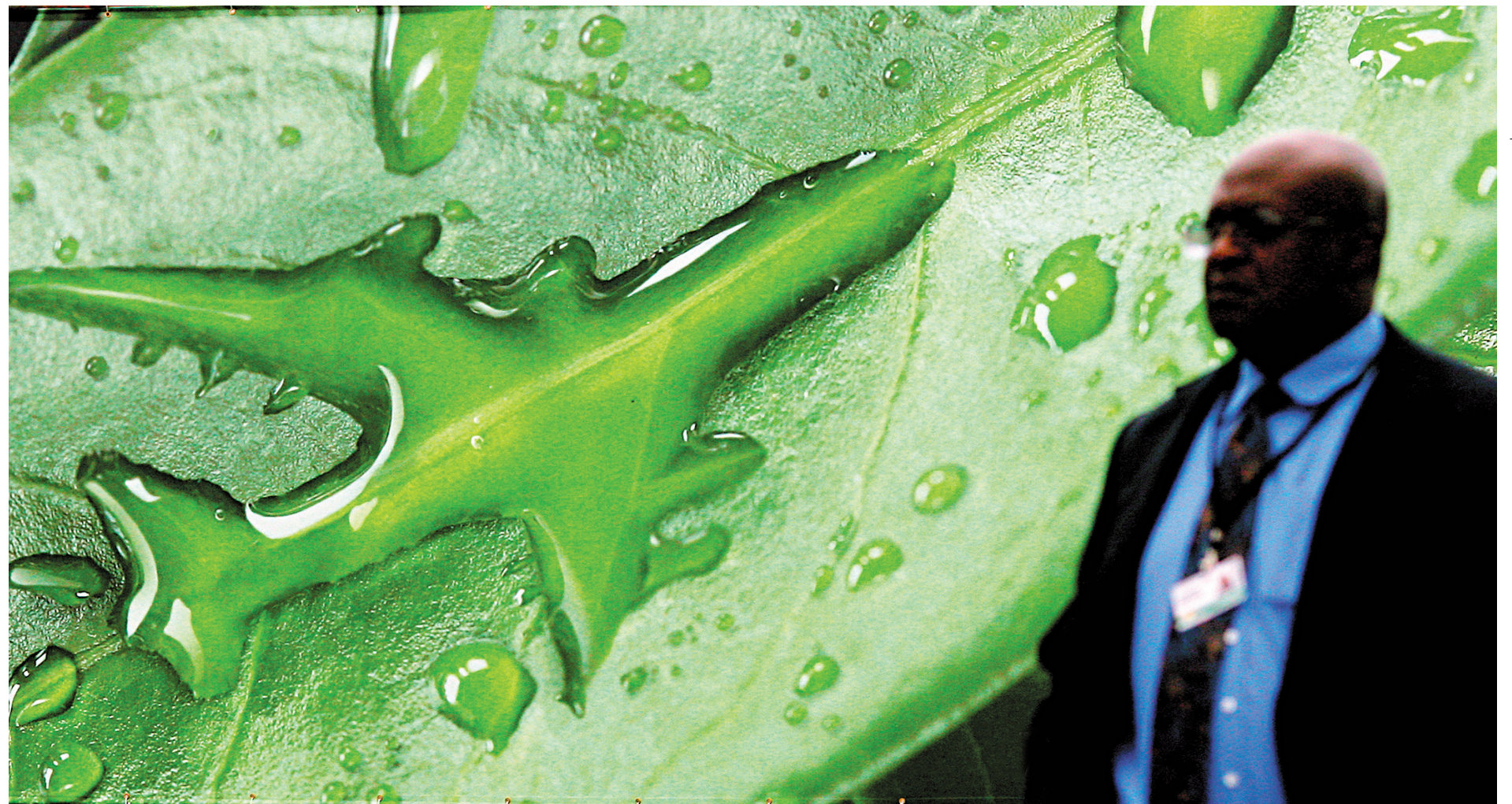
Affiche vue au salon aéronautique de Farnborough, au Royaume-Uni, il y a deux ans, quand l'industrie de l'aviation cherchait à montrer qu'elle aussi s'engageait à prendre le virage vert.