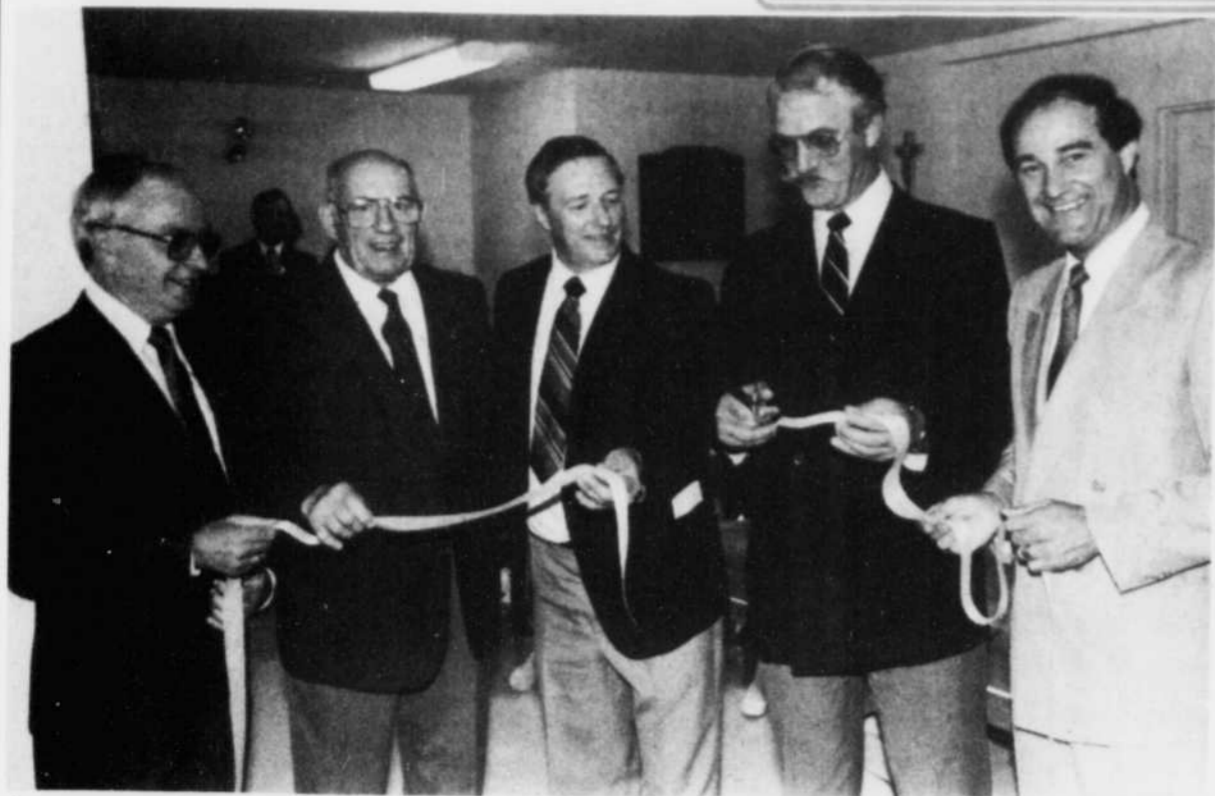
Inauguration des Terrasses Belle Vue

Plusieurs personnalités ont participé en fin de semaine à l'inauguration et la bénédiction des Terrasses Belle Vue, habitations pour personnes pré-retraitées et retraitées autonomes. Sur la photo, lors de la traditionnelle coupure de ruban: le conseiller