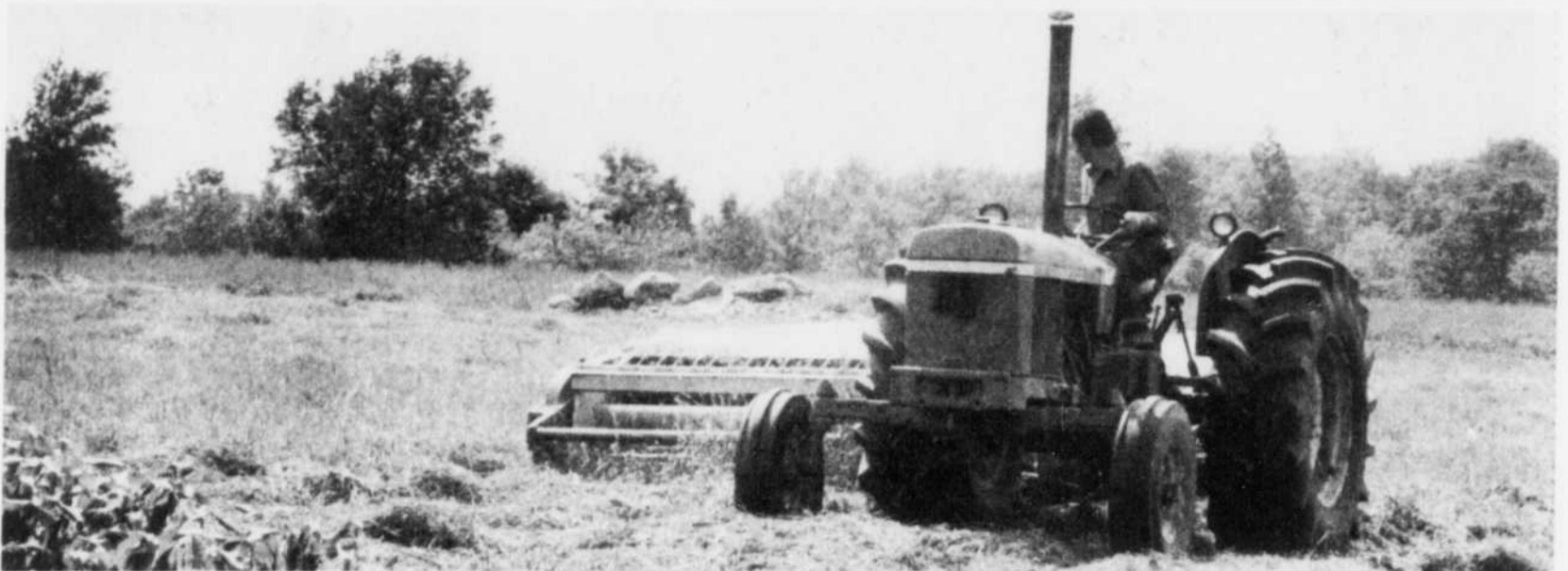
Des semis hâtifs, beaucoup de pluie et un peu de soleil donneront des récoltes très abondantes et d'une bonne qualité cette année en Estrie.

l'impression de traîner de la patte au début de juin mais l'impression était trompeuse. Il a repris le temps perdu à nager dans les terres basses et il file maintenant toutes voiles dehors vers une maturité précoce. A moins que tous les malheurs possibles s'abattent sur lui durant les prochaines semaines, la récolte sera abondante et de bonne qualité.