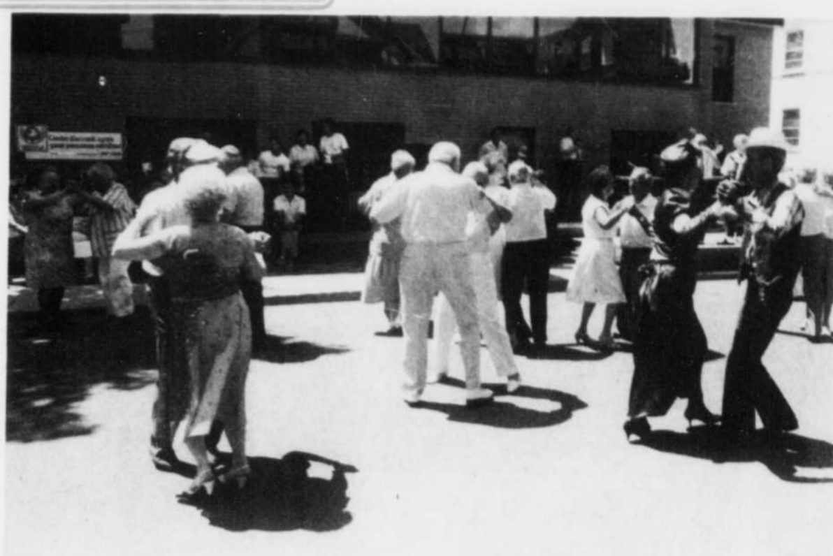
Un "après-midi d'antan"

Près de 400 personnes ont participé hier à un "après-midi d'antan" sur la rue Brooks, à Sherbrooke, à l'invitation des Entreprises sociales et culturel-