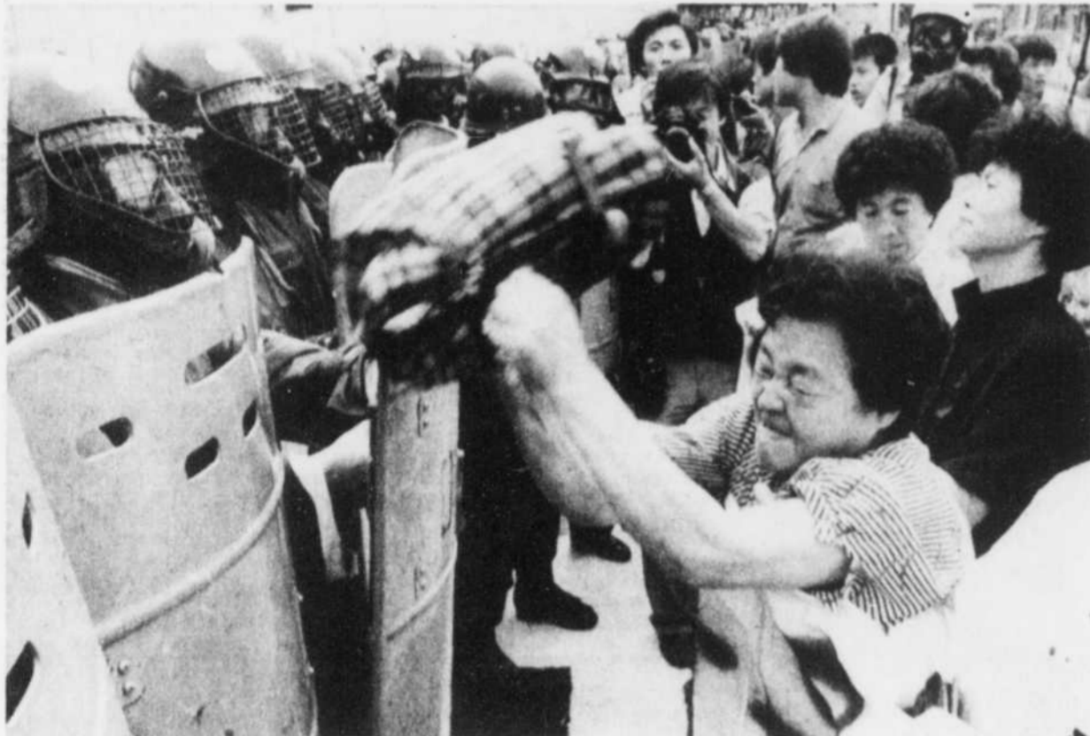
Une Coréenne s'en est prise à des agents de la police anti-émeute avec son sac à main.

L'opposition refuse d'entamer des négociations avec le parti du pouvoir sur la révision de la constitution avant que l'amnistie des prisonniers politiques ne soit proclamée, conformément aux promesses faites par Chun.