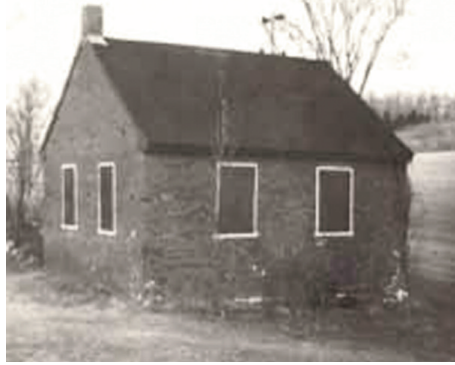
L'école de Stanstead en 1817