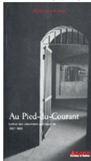
Lettres des prisonniers politiques de 1837-1839, Ed. Comeau & Nadeau.

avec sa famille. Ainsi, en 1844, il essaie d'intéresser le Comité de la FCMS à l'établissement d'un pensionnat protes-