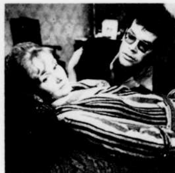
L'Art d'être aimée

television A l'affiche du Festival du cinéma polonais contemporain , le mardi 8 mars à 11 h. 30 du soir, un film d'Andrzej Wajda : Lotna . S'inspirant d'une nouvelle de Zukrowski, Wajda a voulu évoquer la guerre de 1939. Film poétique bien plus que drame de guerre, Lotna s'ouvre sur l'automne. Des cavaliers traversent un champ et la caméra les attend au carrefour. Tandis que les obus éclatent, une jument grise traverse le champ, suivie des yeux par les hommes qui se sont arrêtés. C'est ainsi que Wajda nous présente les trois personnages principaux du film : le capitaine Chodakiewicz, le lieutenant Wodnicki et l'aspirant Grabowski. Les trois hommes partagent la même admiration pour la magnifique jument, qui devient propriété du premier. Chacun la revendiquera à son tour, même s'il semble qu'elle porte malheur à son propriétaire.