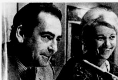
À la radio, "Place aux femmes", du lundi à vendredi à 2 h. 30.