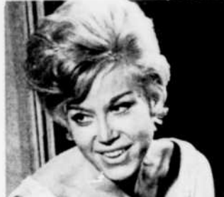
Leontyne Price et Mathé Altéry interpréteront "De la musique le long de mes vers", à 2 heures.