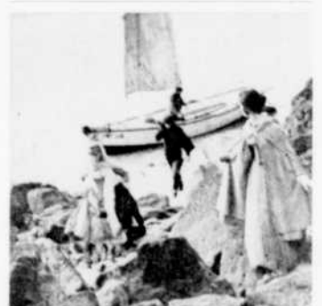
"Amélie ou le Temps d'aimer"

11.00—Supplément régional CBOFT—Dernière édition 11.25—Nouvelles du sport 11.30—Les Incorruptibles "Cognac trois étoiles", avec Robert Stack et Steve Cochran. Un proxénète, fabricant d'alcool, veut substituer son produit de qualité inférieure à un cognac importé de France. 11.00—Téléjournal 11.20—Supplément régional CBOFT—Dernière édition 11.25—Nouvelles du sport 11.30—Les Incorruptibles "Cognac trois étoiles", avec Robert Stack et Steve Cochran. Un proxénète, fabricant d'alcool, veut substituer son produit de qualité inférieure à un cognac importé de France.