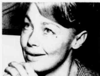
"Motif de divorce: l'amour", avec Dany Robin, jeudi soir à 11 h. 30.