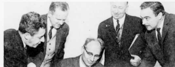
À la radio, "La parole est d'or", le samedi à 6 h. 15 et le jeudi à 2 heures de l'après-midi.