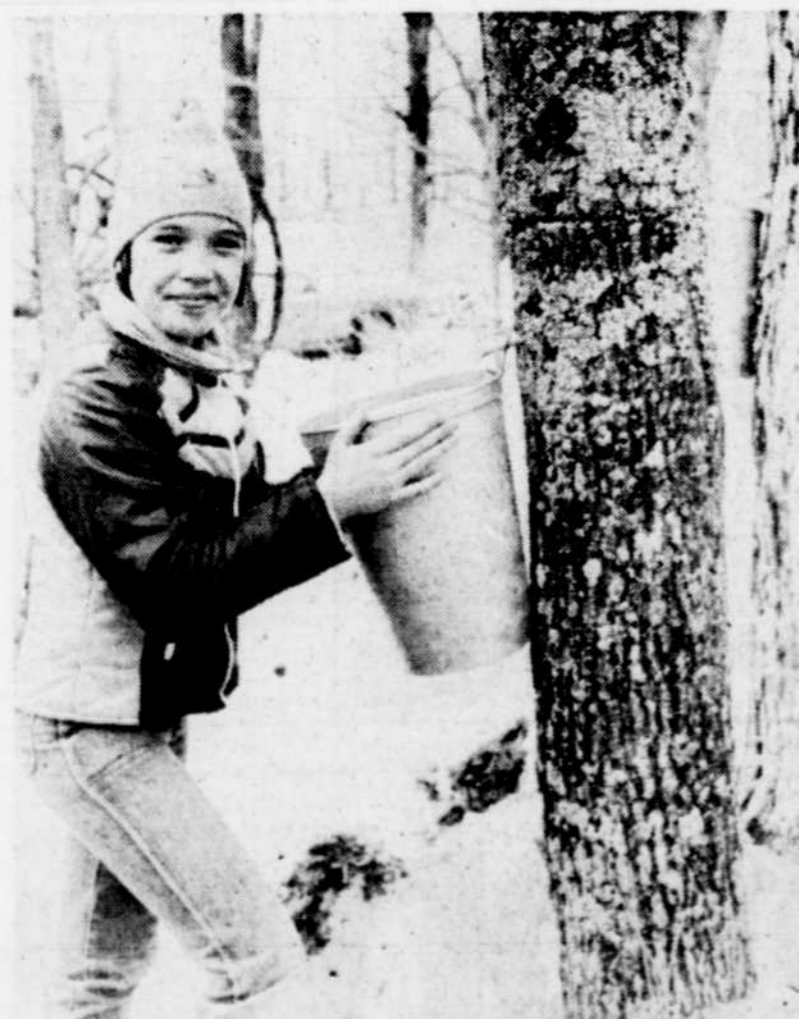
Quelque 35 pour 100 des érablières font encore la cueillette de l'eau d'érable à l'aide de chaudières. Une bonne occasion de se sucrer le bec en pleine nature.

Le ministère les remet, quant à lui, au 200 chemin Sainte-Foy à Québec, au service des renseignements ou on peut commander par la poste en écrivant à ministère de l'Agriculture, des Pêcheries et de l'Alimentation, C.P. 1693, Québec, G1K 7J8.