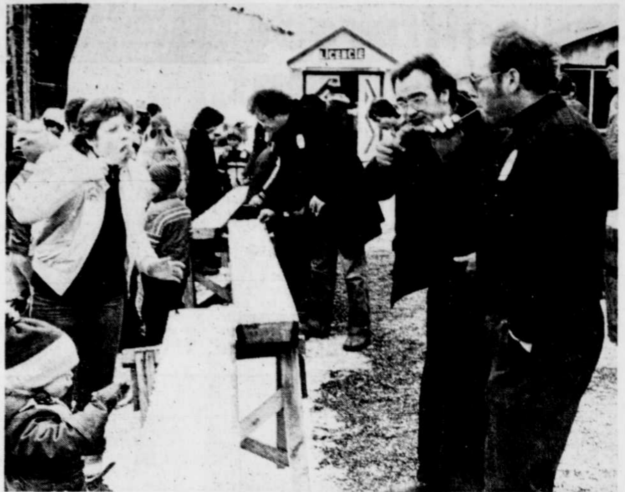
Avec cet hiver qui n'en finit plus de finir, la saison des sucres pourrait bien durer jusqu'au début de mai dans plusieurs régions, même si la récolte de cette année est plutôt moyenne.

D'après M. Gauvreau, on relève en moyenne cette saison 2,500 entailles par érablière, dont 65 pour 100 sont munies d'un système de tubulure, alors que 35 pour 100 de la cueillette s'effectue encore à la chaudière. Les deux combinés donnent un ren-