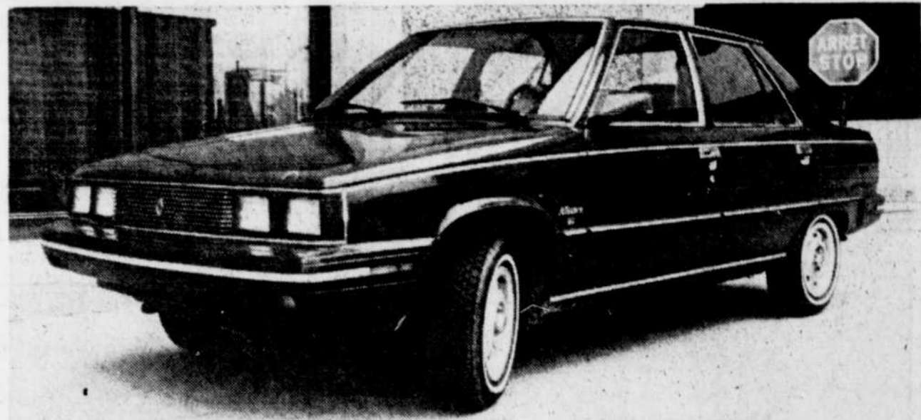
L'Alliance de Renault-AMC, de conception européenne mais de fabrication américaine, illustre bien le virage de cette technologie mixte bien acceptée par les consommateurs.