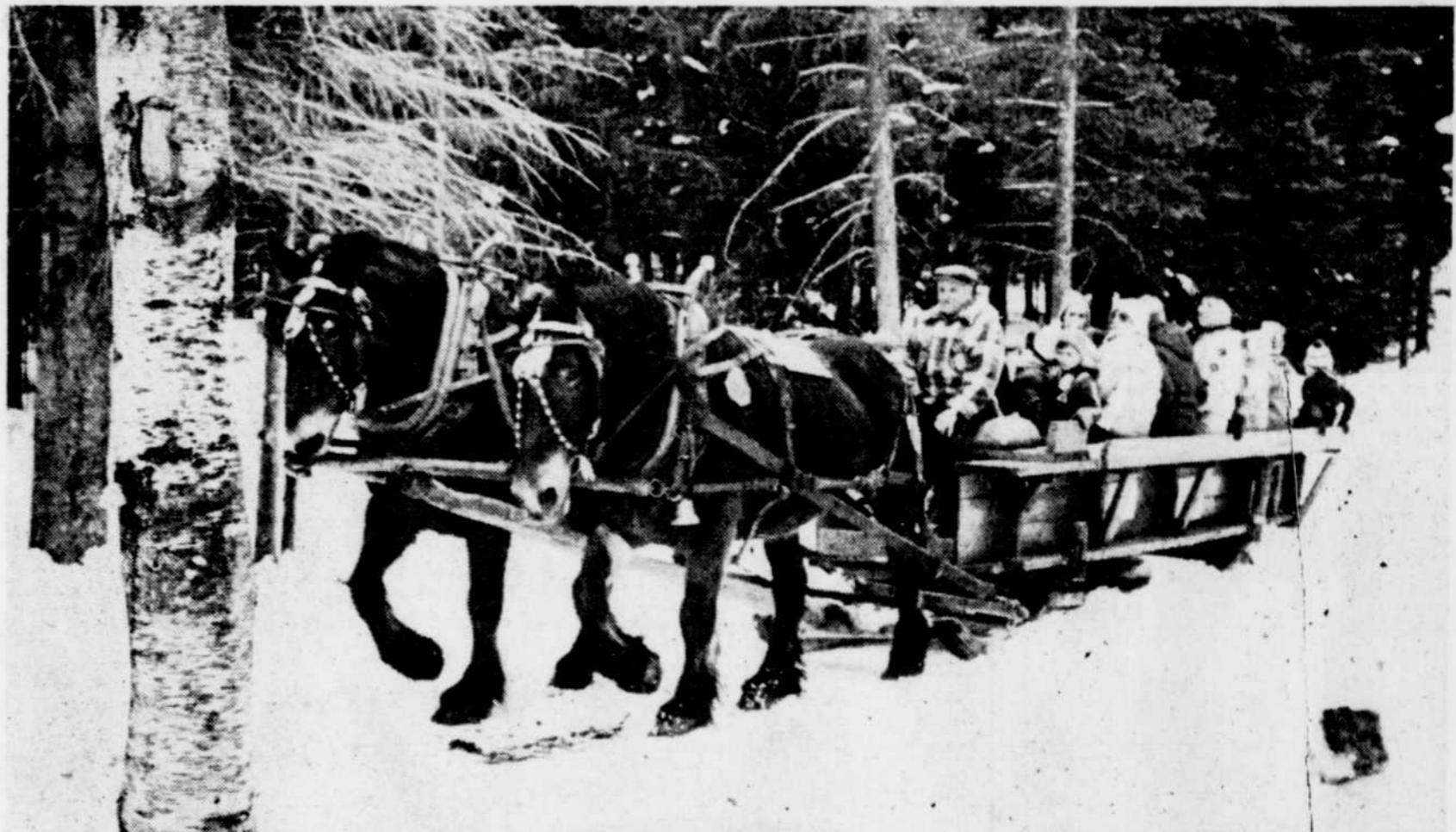
Une visite à la cabane à sucre ne serait vraiment pas complète, sans la traditionnelle promenade dans un traineau tiré par des chevaux.