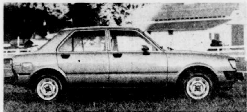
Agréable à conduire, la Tercel à traction avant est la voiture la plus en demande de Toyota Canada.

Plus de 600 automobilistes et lecteurs du SOLEIL ont répondu au sondage sur la durabilité des voitures tel que conçu par le Club automobile du Québec et les résultats de ce questionnaire global seront connus au début de l'été.