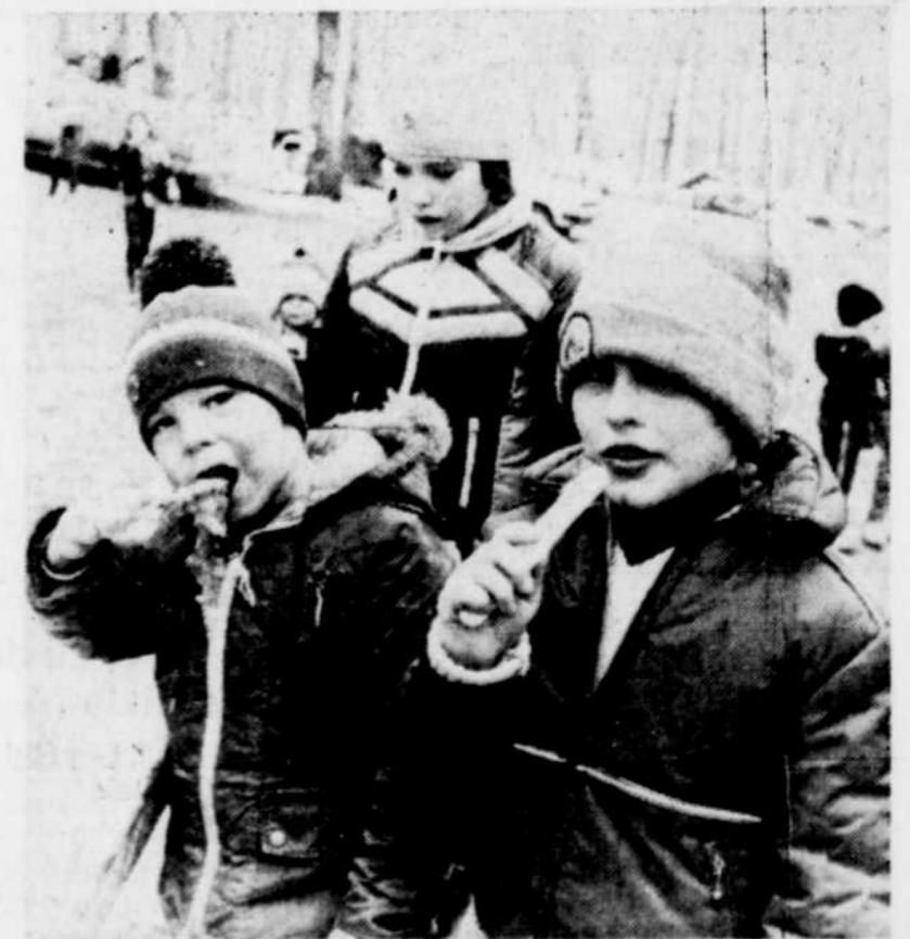
De la bonne tire. On ne s'en lasse jamais!