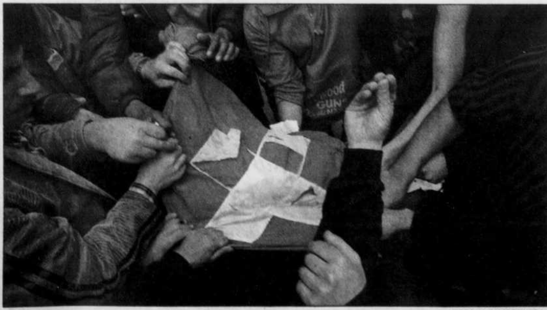
Des manifestants libanais s'arrachent un drapeau danois. Les manifestations contre les caricatures sont des manifestations contre l'impérialisme. Mais elles ne le sont pas, comme jadis, au nom d'un idéal socialiste ou démocratique. La lutte est menée au nom de l'islam.

Et c'est Bush, Harper et Ben Laden qui riront dans leur barbe!