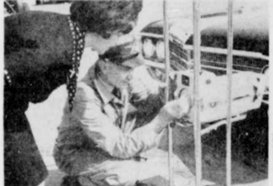
LA CLINIQUE SERA A VICTORIAVILLE EN FIN SEPTEMBRE. — Le ministère des Transports et Communications de la province de Québec a annoncé la tenue de la prochaine session à Victoriaville. Cette clinique aura donc lieu les 28, 29 et 30 septembre courant. Cette photo prise lors d'une récente clinique donne une idée de cette série d'examen.

En premier lieu, il s'agit d'une campagne d'éducation populaire; c'est le côté clinique de la campagne, qui s'adresse directement aux conducteurs de véhicules automobiles. Le second aspect porte sur le véhicule lui-même, dont il s'agit de voir s'il offre le maximum de sécurité possible, tout autant pour les personnes qui s'y trouvent que pour les autres circulant sur les routes.