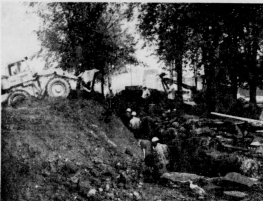
EXCAVATION. — La firme Benoit Construction, de Lac-Mégantic, est présentement à effectuer les travaux d'excavation et de pose de la conduite d'adduction de 16 pouces qui doit relier le pont de la Chaudière avec l'usine de pompage de la Baie des Sables.

Cliniques antituberculeuses Lundi, le 20 septembre, de 9 h. 30 à 11 heures a.m., et de 2 heures à 4 heures p.m., à l'Unité sanitaire, rue Pie XI, Thetford Mines.