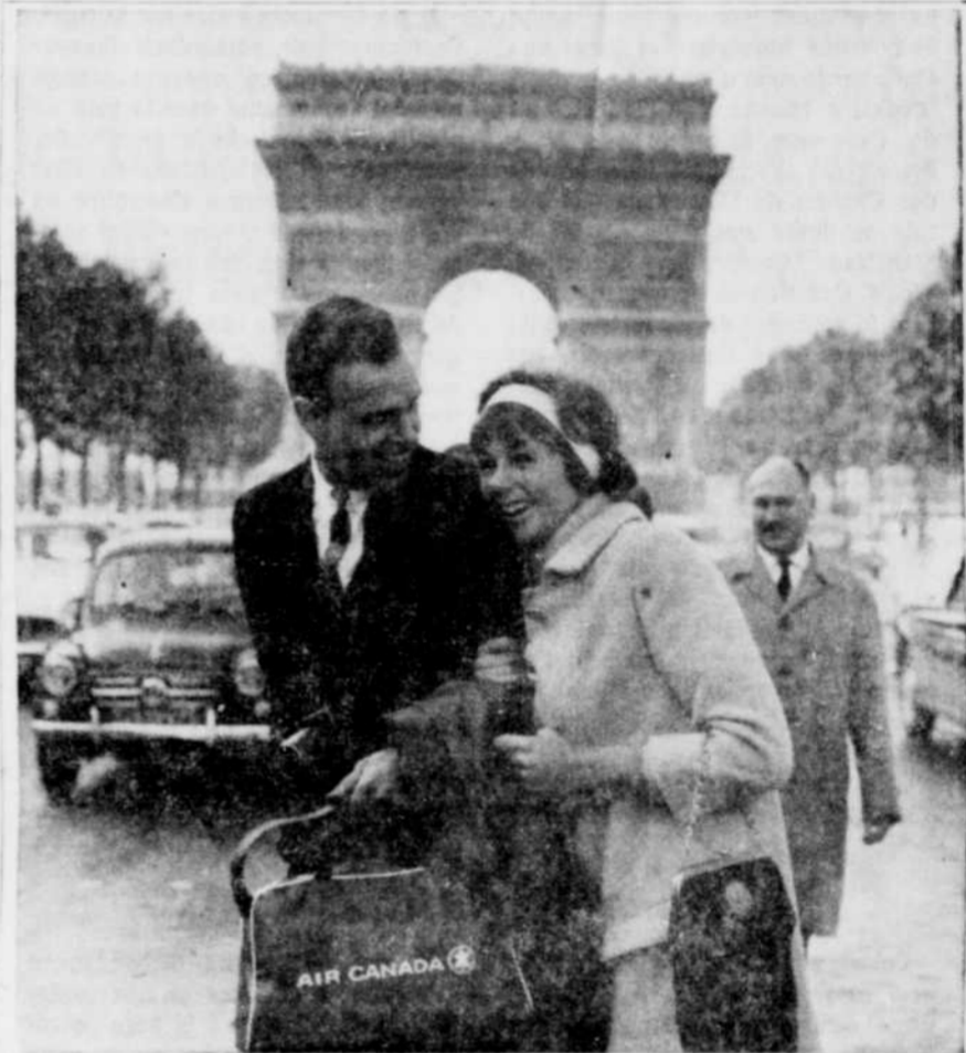
A ne pas manquer: une promenade sur les Champs-Élysées