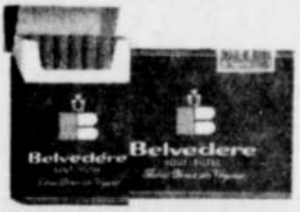
Nouveau format extra-long