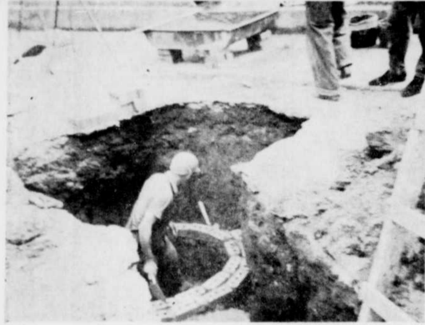
PUISARDS. — Les employés de la ville d'East Angus posent ici un puisard de chaque côté de la rue Maple, et des tuyaux de ciment en vue de l'élargissement de cette rue qui conduit à l'église N.D.G. Ces travaux sont sous la direction de M. Thériault.