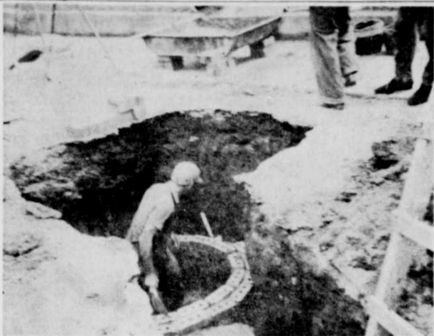
PUISARDS. — Les employés de la ville d'East Angus posent ici un puisard de chaque côté de la rue Maple, et des tuyaux de ciment en vue de l'élargissement de cette rue qui conduit à l'église N.D.G. Ces travaux sont sous la direction de M. Thériault.