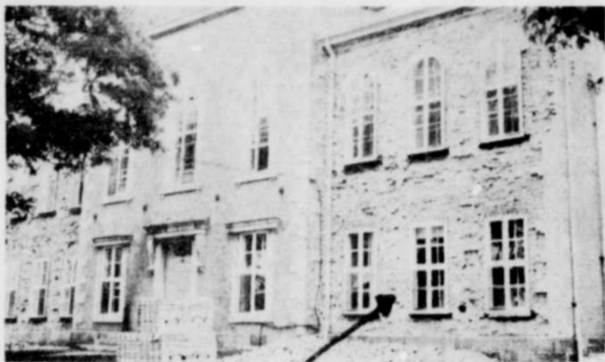
REPARATIONS EN COURS A ARTHABASKA. — Les travaux de réparations ont débuté au Palais de justice d'Arthabaska. Cette photo de la façade l'indique bien, mais il faut noter immédiatement que ces travaux ne doivent pas retarder la construction de l'agrandissement pour l'an prochain. L'honorable Albert Morissette, ministre d'Etat et député du comté, l'a souligné à quelques reprises lors de la conférence de presse d'hier matin.