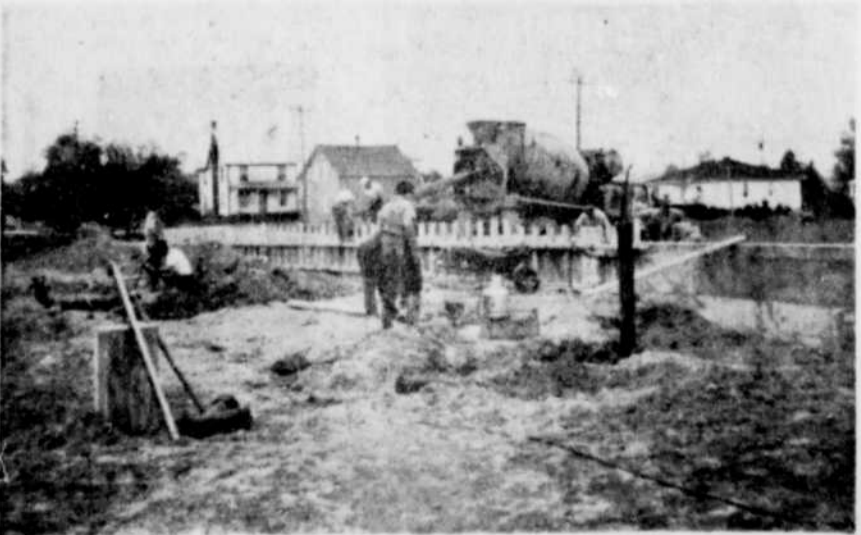
AGRANDISSEMENT. — Des ouvriers sont présentement à construire une extension d'une superficie de 704 pieds par 149,2 pieds. Cet agrandissement permettra des meilleures conditions de travail et servira à aménager l'office général, le caféteria, une salle de conférence, salle de bain, etc. Les travaux sont sous la direction de la Co. Williams et le contracteur est M. Labbé.