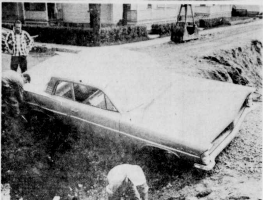
POSITION PRÉCAIRE. — Un automobiliste s'est trouvé dans une position plutôt précaire hier après-midi quand sa voiture est allée s'arrêter dans une excavation du chantier de l'égout collecteur à l'intersection Centre et Avenue du Parc à Granby.