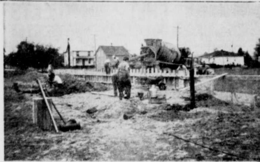
AGRANDISSEMENT. — Des ouvriers sont présentement à construire une extension d'une superficie de 704 pieds par 1492 pieds. Cet agrandissement permettra des meilleures conditions de travail et servira à aménager l'office général, le caféteria, une salle de conférence, salle de bain, etc. Les travaux sont sous la direction de la Co. Williams et le contracteur est M. Labbé.

Les automobilistes se plaignent de ce que ces arrêts ralentissent considérablement la circulation surtout sur l'heure du midi et vers 4 heures alors que les employés de la compagnie Canadian Johns-Manville retournent à la maison. L'enseigne marquée "arrêt" est installée de 7h.30 à 9 heures a.m., de 11h.40 a.m. à 1h.30 p.m. et de 2h10 p.m. à 4h.15 p.m. Si l'on maintient l'arrêt obligatoire aussi longtemps, c'est que l'horaire des classes maternelles varie avec l'horaire des autres classes. La route 32 est la propriété du gouvernement provincial. Le ministère de la Voirie a déjà été saisi de plusieurs demandes de la ville d'Asbestos qui réclame l'aménagement de lumières de circulation sur cette voie.