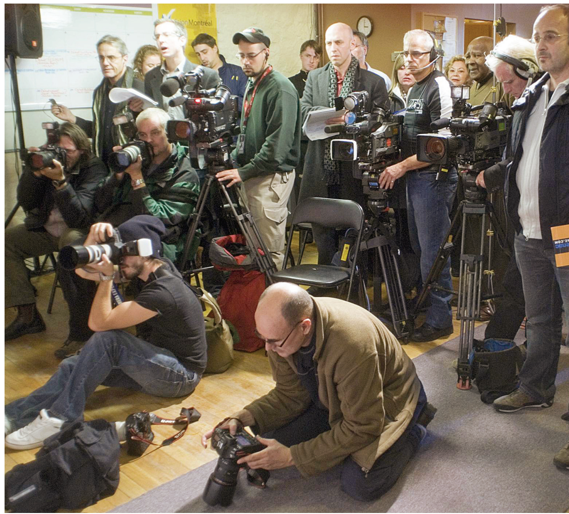
Il faut arrêter de discuter de l'information selon la perspective des journalistes ou des entreprises de presse, il faut rendre l'information disponible aux citoyens partout sur le territoire.

Il faut arrêter de discuter de l'information selon la perspective des journalistes ou des entreprises de presse, il faut rendre l'information disponible aux citoyens partout sur le territoire. Dire cela