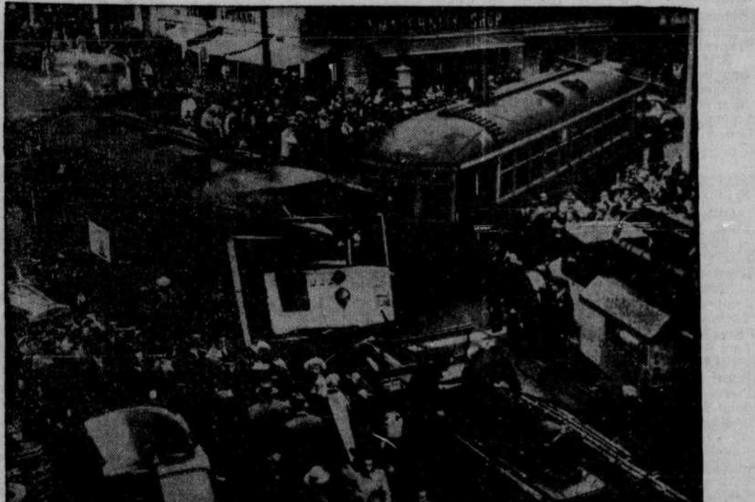
Collision de tramways à San-Francisco. Onze personnes ont reçu des blessures dans cet accident. De lourds dommages ont été infligés aux deux voitures.

"Ce volume réunit 150 Petites Fleurs cueillies avec respect et amour dans la vie extraordinaire de Marie Rivier." "Les Filles de Marie Rivier ont formé trois bouquets avec ces petites fleurs embaumées du parfum évangélique." Au service du Père qui est aux Cieux Charité envers le prochain Vers les sommets. Volume de 384 pages. Au comptoir: $1.50 Par la poste: $1.80 SERVICE DE LIBRAIRIE DU "DEVOIR"