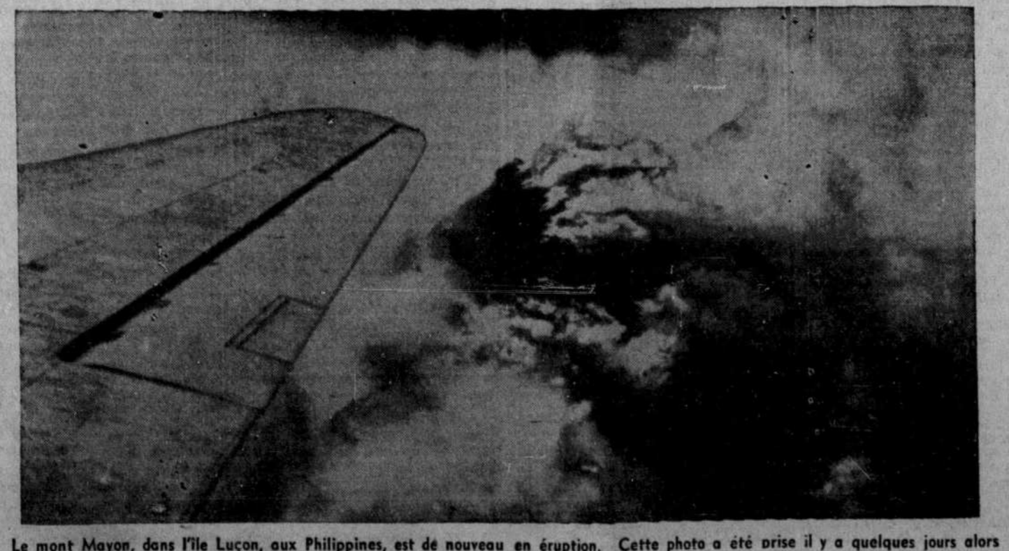
Le mont Mayon, dans l'île Luzon, aux Philippines, est de nouveau en éruption. Cette photo a été prise il y a quelques jours alors que le volcan crachait la lave et la fumée.