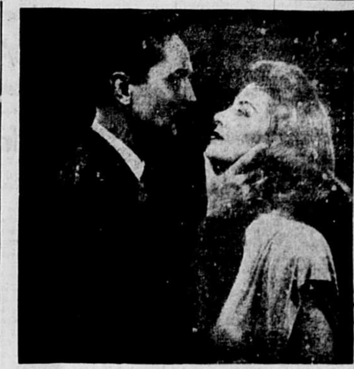
Franchot Tone et Janet Blair, vedettes du film "I Love Trouble", qui prendra l'affiche du Princess, aujourd'hui.

Aucune commande par téléphone Imprimerie CANADIAN CONCERTS & ARTISTS Inc.