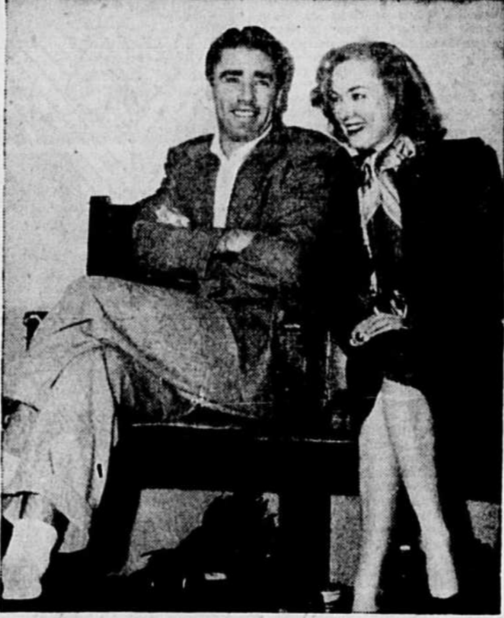
Après avoir visité les studios de la MGM, Peter Lawford qui en verra dans "Good News" et Audrey Totter, vedette de "The High Wall", se reposent.