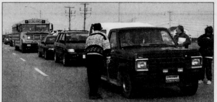
COLLABORATION SPÉCIALE, HENRI MICHAUD

Le syndicat des conducteurs d'autobus scolaires de Baie-Comeau a entériné, hier l'entente de principe conclue récemment avec Autobus Manic, filiale de la compagnie Transport Sgesco. Le nouveau contrat de travail, d'une durée de cinq ans pour cette trentaine de chauffeurs promet des hausses salariales de 1% en 1995-96, rétroactif au 1er juin 1995. Le syndicat, affilié à la CSN, obtient des améliorations générales des conditions de travail ainsi que l'implantation d'un REER collectif avec contribution de l'employeur. Les syndiqués se disent satisfaits de l'entente qui met un terme à six mois de négociations difficiles. A.S.P.