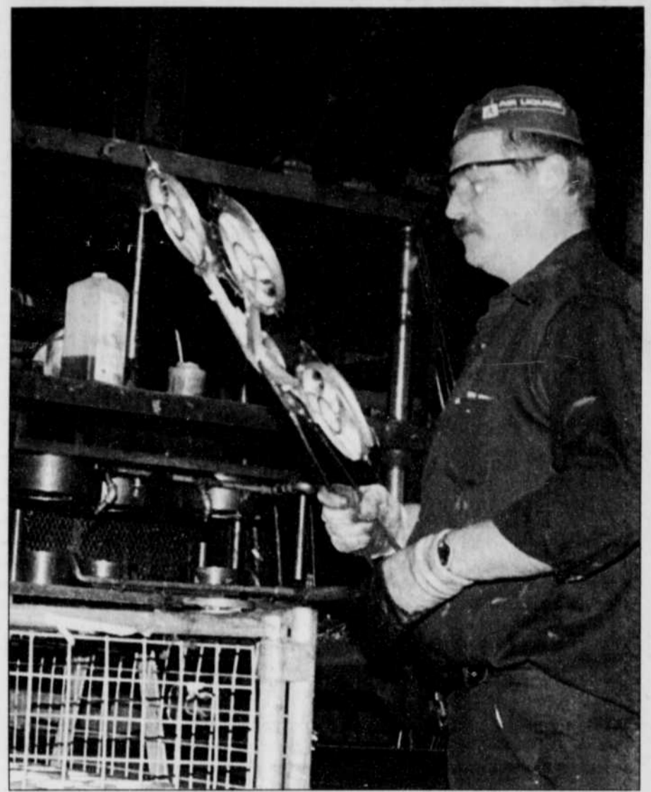
Un travailleur examine une pièce qu'il vient de mouler.

La nouvelle usine permettra aussi à AMT d'augmenter son autonomie dans la production de moules et d'élargir le bassin de sa clientèle.