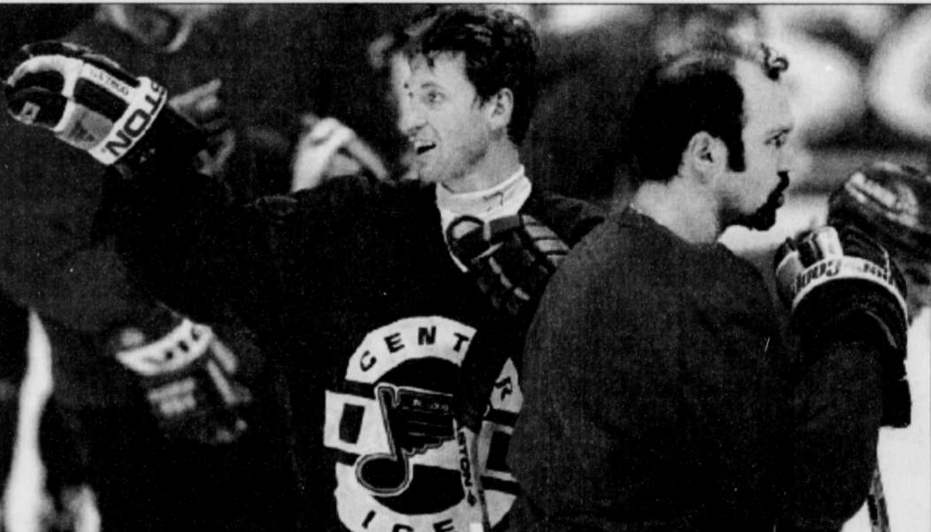
Charlie Huddy se repose tandis que Wayne Gretzky plaisante avec un coéquipier durant l'entraînement des Blues.