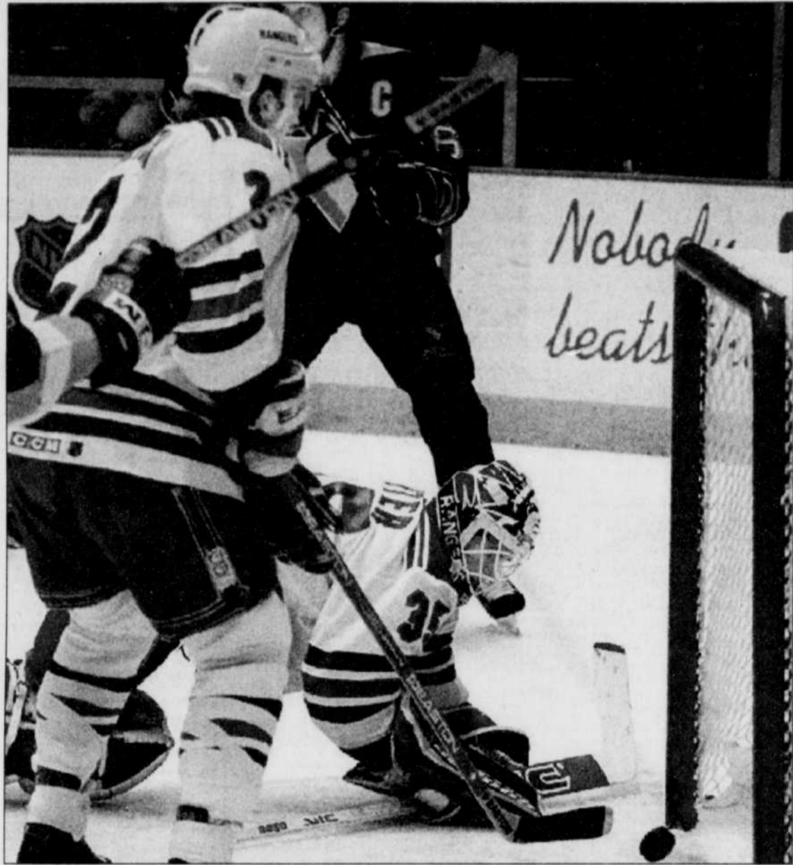
Mario Lemieux vient de déjouer Mike Richter.