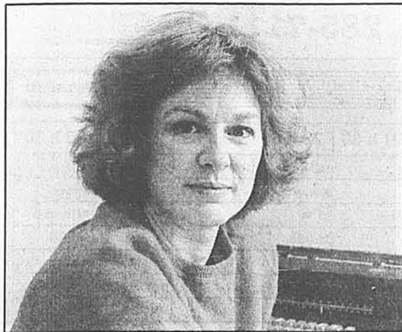
Micheline Lanctôt qui a présenté la Onzième spéciale à Rouyn-Noranda, travaille déjà à un autre film, Tarzana , en attendant la Vie d'un héros .

«Je fais du cinéma en tant que personne, pas en tant que femme. S'il fallait que les Noirs fassent du cinéma de Noirs. Que les handicapés fassent du cinéma de handicapés. On n'en sortirait plus. Ce serait un ghetto à l'envers. Je fais les festivals de films de femmes comme la peste. Moi ça me fait crier. Je suis une femme, mais je fais du cinéma. Point».