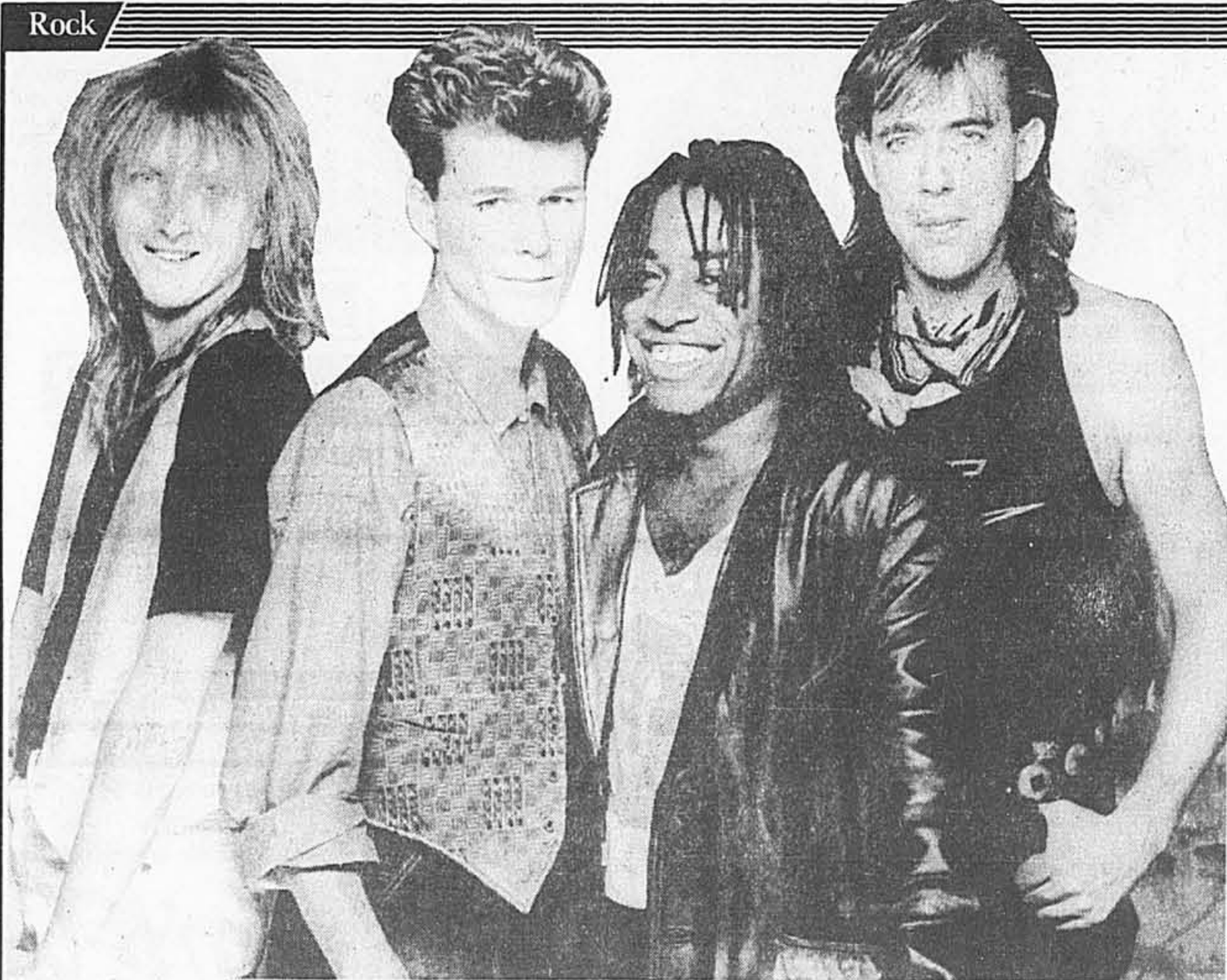
Big Country: Bruce Watson, Stuart Adamson, Tony Butler et Mark Brzezicki.