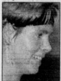
Québec en amour avec la 11e joueuse au monde