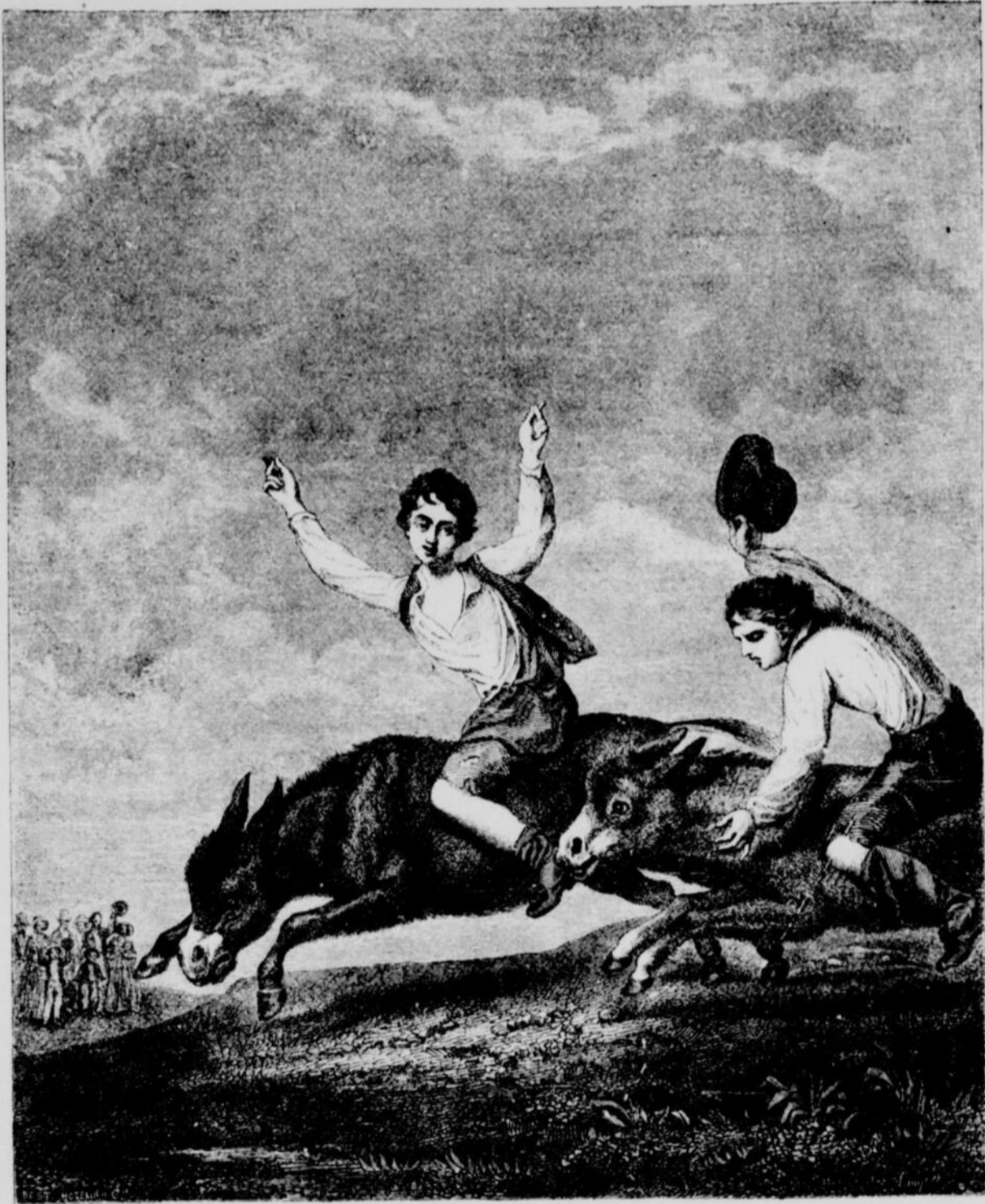
LA COURSE A ANE.

Ce vieillard podagre n'est plus un être seulement ridicule, ce n'est plus un pêcheur : c'est un maniaque, un monomane ; sa passion a dégénéré en démence ; il ne provoque plus le rire, il fait pitié.