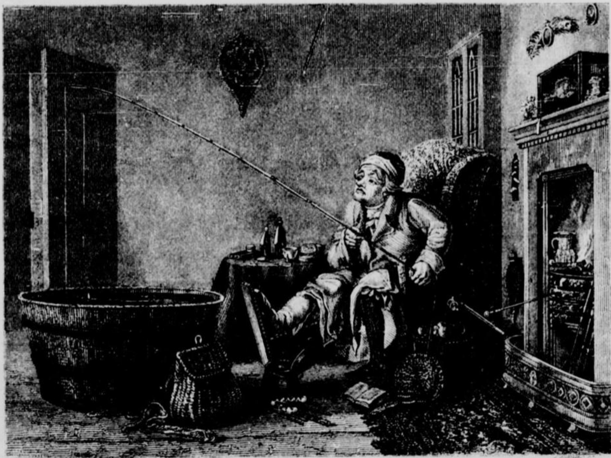
LA PECHE AU BAQUET, TABLEAU DE LANCE

Appelle-t-on chasseur celui qui, indifférent au lever du jour, à la rosée qui diamante les champs, à la senteur pénétrante des bois, à l'art de découvrir et de suivre une piste, à l'ardeur de déjouer les ruses du gibier, réduit toute son ambition à voir tomber sous le plomb mortel une bête vivante quelle qu'elle soit, le pinson sur un poirier, le canard barbotant dans une mare ?