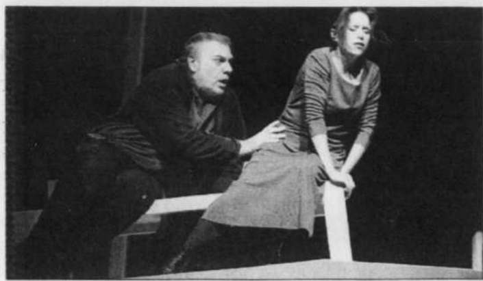
Denis Marleau propose une pièce qui suit le rythme de l'âme.