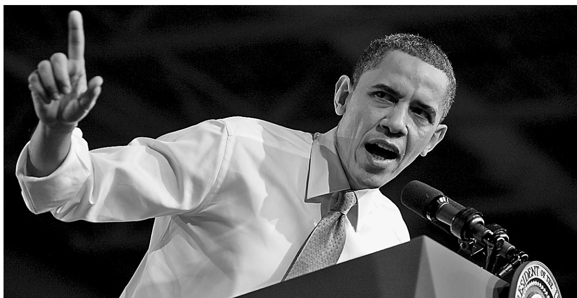
Le président américain Barack Obama a récemment décoché une flèche bien méritée aux dirigeants de la NCAA.

— Pourquoi avoir une éducation était-il si important pour toi?