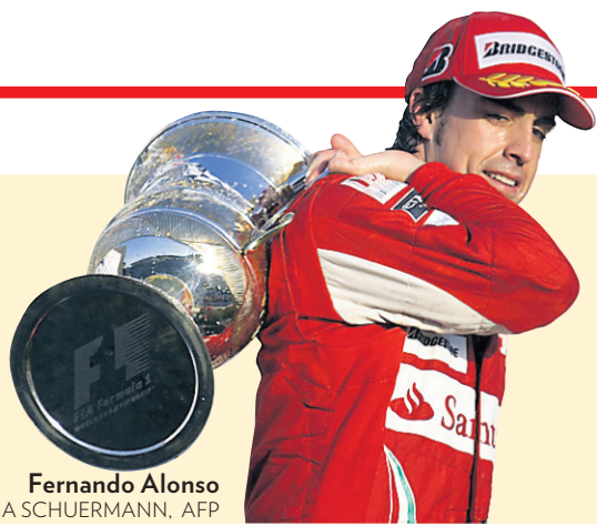
Fernando Alonso