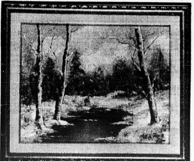
«Scène d'hiver» par Cantrell (31" x 35" encadré) Ord. 475$, Vente 170$, moins 40%: prix final 99$

UNE OFFRE INCROYABLE SUR DES PEINTURES ORIGINALES 40% RABAIS 40% A.D.D.I.T.I.O.N.N.E.L (sur des prix réduits préalablement)