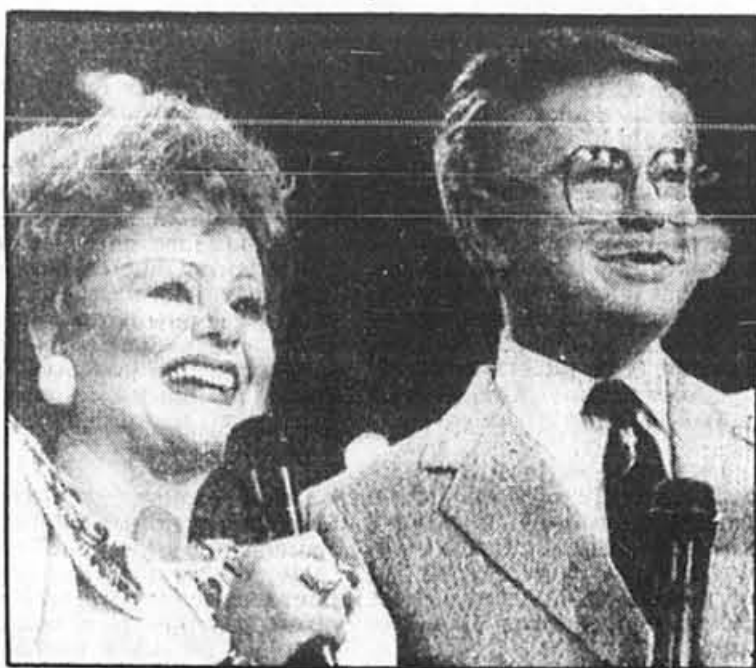
Jim Bakker et sa femme Tammy.