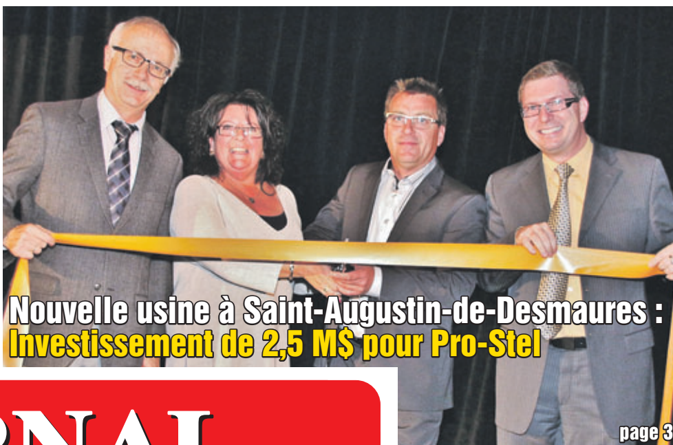
Nouvelle usine à Saint-Augustin-de-Desmaures : Investissement de 2,5 M$ pour Pro-Stel