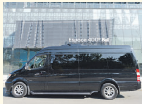
La nouvelle limo de Limo Québec.

Le groupe Limo Québec a récemment fait l'acquisition d'un tout nouveau véhicule pour satisfaire sa clientèle professionnelle et corporative. Le véhicule, une camionnette corporative de marque Mercedes, a plusieurs commodités pour permettre à ses passagers de se déplacer sans interrompre leur travail : internet, écrans, lecteur DVD, tables de travail, positionnement des sièges favorable à la discussion, etc. Le véhicule est bien sûr, accompagné d'un de nos chauffeurs. Tous sont discrets courtois et efficaces.