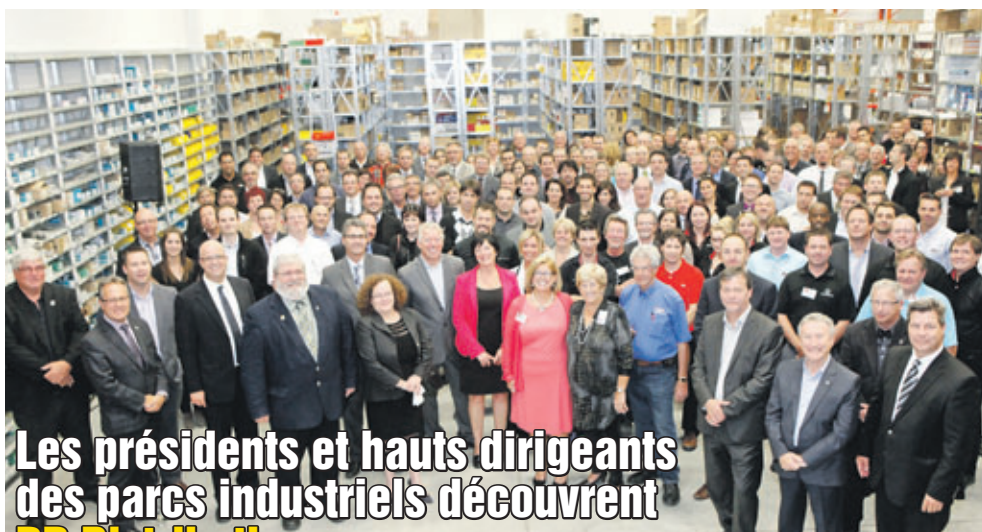
Les présidents et hauts dirigeants des parcs industriels découvrent PR Distribution