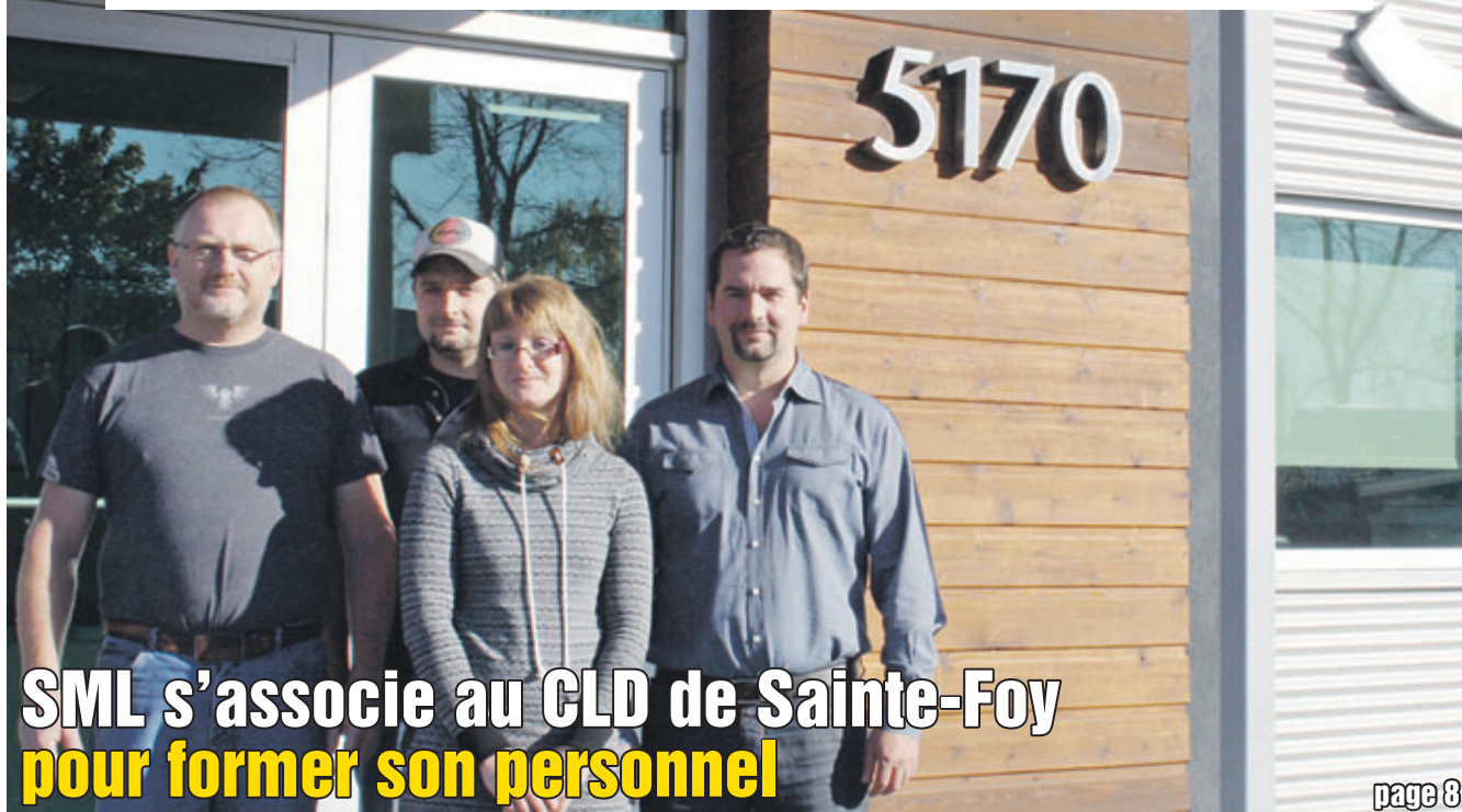
SML s'associe au CLD de Sainte-Foy pour former son personnel