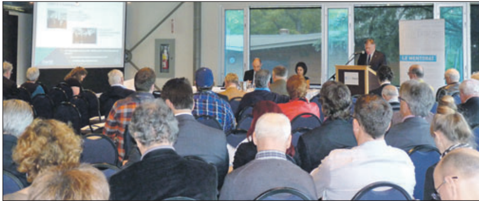
C'est à l'Aquarium du Québec qu'avait lieu récemment l'assemblée générale annuelle de SAGE - Mentorat d'affaires à laquelle ont participé des mentors, mentorés et partenaires.