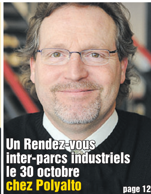
Un Rendez-vous inter-parcs industriels le 30 octobre chez Polyalto