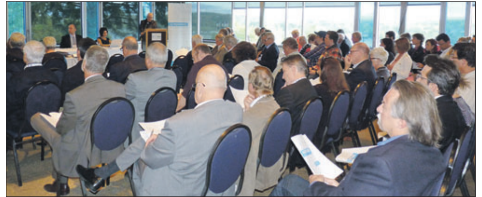
L'assemblée générale annuelle de SAGE - Mentorat d'affaires a réuni près d'une centaine de personnes.