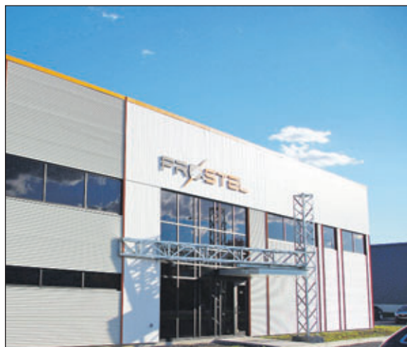
La construction de l'usine située au 205, rue de Copenhague dans le parc industriel de Saint-Augustin-de-Desmaures représente pour l'entreprise québécoise un investissement de 2,5 M$.