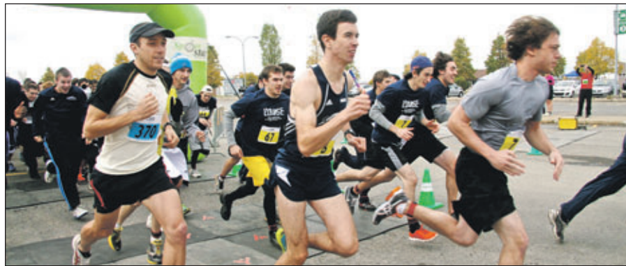
Cette deuxième édition de la course de la Fondation du Cégep de Sainte-Foy – Desjardins réunira près de 600 participants du grand public et de la communauté collégiale.

Le coût de l'inscription pour une équipe de quatre coureurs est de 200 $ pour un partenaire corporatif. Information : www.cegep-ste-foy.qc.ca/fondation Inscription au 418 659-6600, poste 3602 ou louise.vezina-paquet@cegep-ste-foy.qc.ca ■