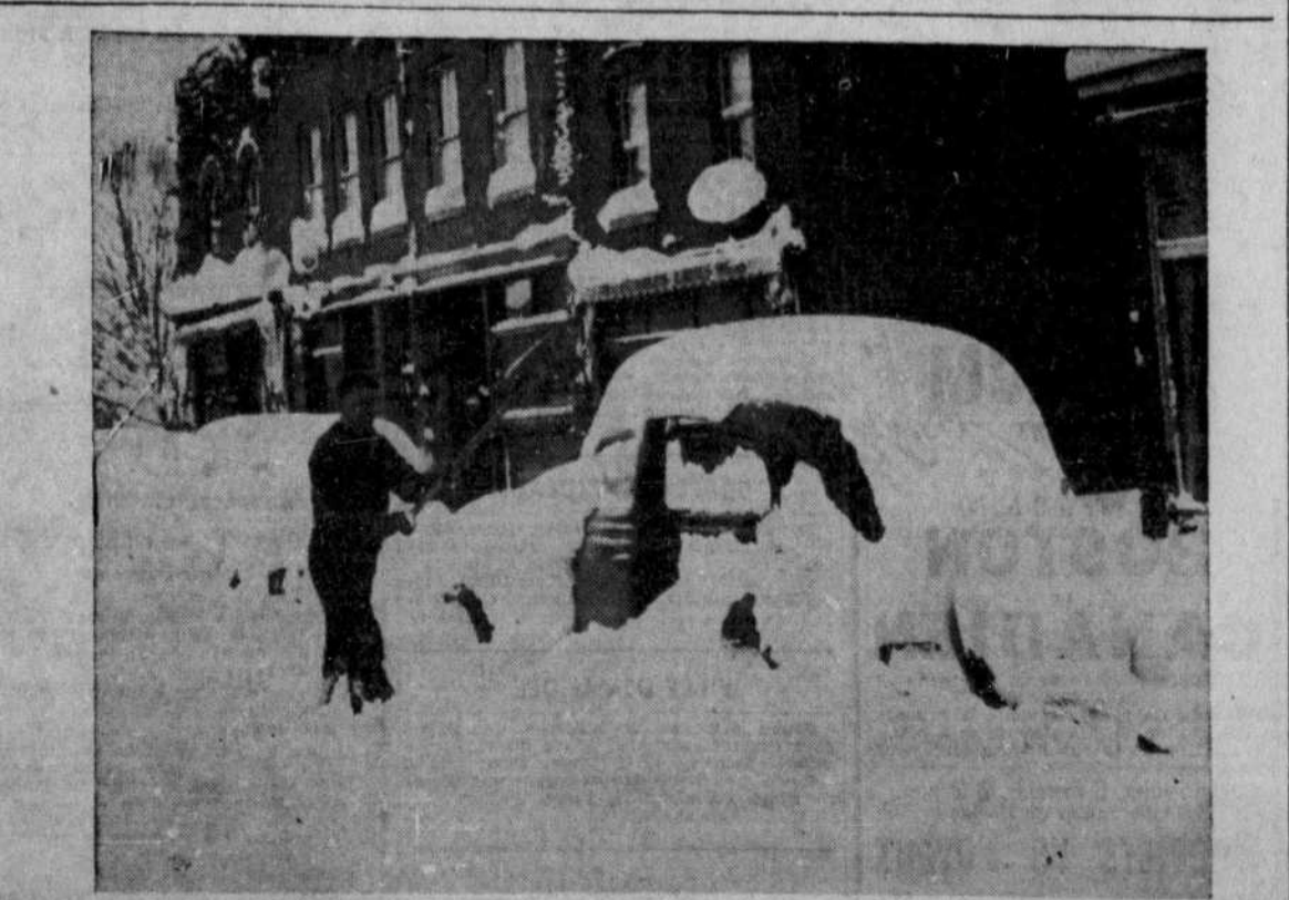
Voici des automobiles abandonnées sur la rue principale de Gravenhurst, Ontario. La neige, poussée par une violente rafale durant deux jours, a complètement bloqué les routes. Des centaines d'automobilistes sont restés en panne. Les hôtels et les maisons de touristes ont joui d'une recrudescence de revenus.