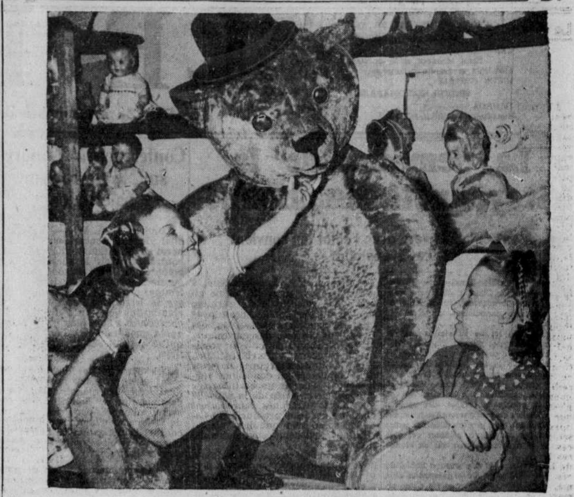
Il aurait été bien malheureux, n'est-ce pas que ce teddy bear de taille géante eût ignoré l'atelier de réparation des jouets usagés? Il a eu les honneurs de l'exposition, au royaume des jouets, à la vente de charité annuelle du Patriotic Salvage Corp. à Winnipeg.

LA DECOUVERTE DE LA PENICILLINE La découverte de la pénicilline n'est pas moins merveilleuse et propre à frapper l'imagination. Un jour, un de ces nombreux champignons qui sont constamment en suspension dans l'air vint échouer sur une boîte où le docteur Fleming cultivait des microbes appelés staphylocoques. Une moisissure se développa et, tout autour d'elle, les staphylocoques disparurent. Cette culture tachée d'auréoles circulaires autour du champignon paraissait intrigua le savant. Il l'isola, entrepris sa culture, et un spécialiste l'identifia comme une des 300 variétés de pénicillium, moisissure connue surtout pour son action dans la fermentation des camemberts et roqueforts. Le docteur Fleming mit en contact des bouillons sur lesquels il avait fait pousser du pénicillium notatum avec différentes cultures de microbes; un grand nombre d'entre eux furent détruits; la pénicilline était découverte. Mais ce n'est que 15 ans plus tard que ce nom allait parvenir à nos oreilles, porté sur les ondes universelles. Son efficacité dans les plaies de guerre, les mystères qui entouraient sa naissance et sa fabrication en faisant une arme magique au service des alliés, au même titre que le radar ou la bombe atomique. Et pour tous ceux qui propageaient son nom de bouche à oreille, sans