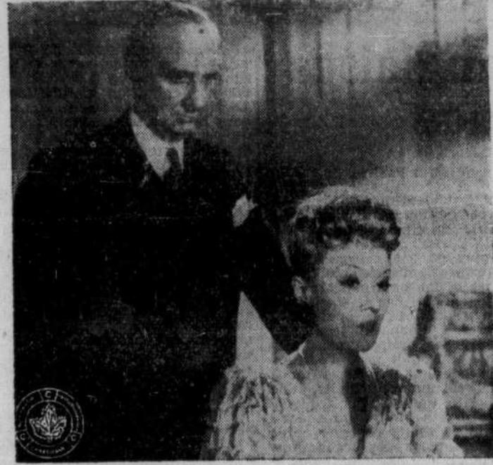
Jean Debucourt et Edwige Feuillère, dans une scène du film "Tant que je vivrai" présentement à l'affiche du Saint-Denis.