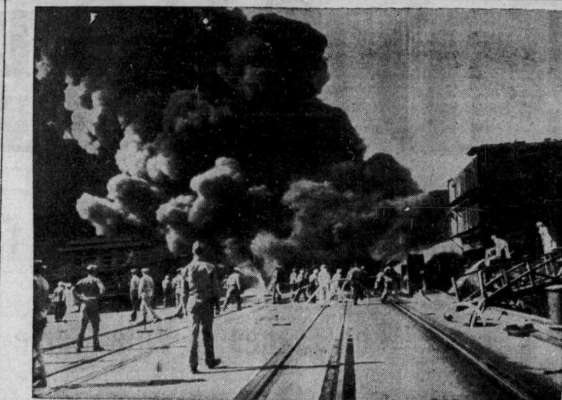
Un incendie spectaculaire a éclaté dans le bassin d'entreposage d'huile à Pearl Harbor, Hawaii. Des pompiers de la marine, assistés de ceux d'Honolulu, ont combattu les flammes. Un relevé de la situation indique peu de dommages et aucune mortalité.

Ce journal est imprimé au no 430 rue Notre-Dame est, à Montréal, par l'Imprimerie Populaire (à responsabilité limitée) éditeur-proprétaire, Georges Pellerin, directeur-gérant. La Canadian Press est seule autorisée à faire emploi pour réimpression de toutes les dépêches attribuées à la Canadian Press et à l'Associated Press ou à l'agence Reuters ainsi que de toutes les informations locales que le "Devoir" publie. Tous droits de reproduction des dépêches particulières du "Devoir" sont également réservés.