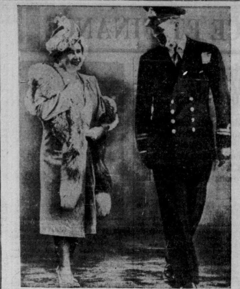
La princesse Elizabeth et le prince Philippe, tels qu'ils paraissent lors d'une nocce l'été dernier. Des tailleurs méditent sur les rumeurs de fiançailles prochaines. Ils craignent de voir leurs invités faire venir leurs toilettes des États-Unis, à cause du rationnement.