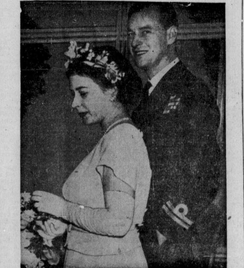
Le rumeur circule, chez les couturiers en vogue de Londres, que la princesse Elizabeth se fiancera prochainement à Philippe de Grèce. On voit ici le prince en compagnie de la princesse royale.