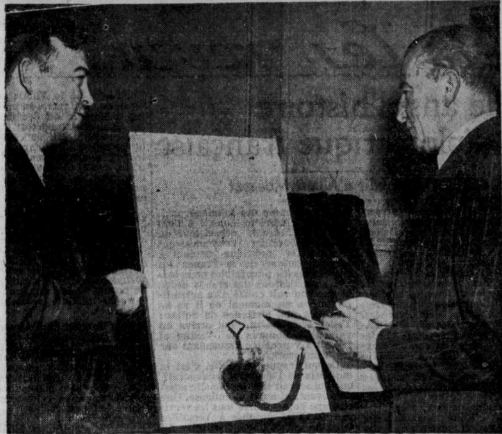
Luther H. Evans, à gauche, libraire du Congrès, et Lord Inverchapel, l'ambassadeur britannique aux Etats-Unis, observent une copie de la Grande Charte, présentée à Washington. Le parlement anglais a autorisé l'abbaye de Lacock à la prêter.