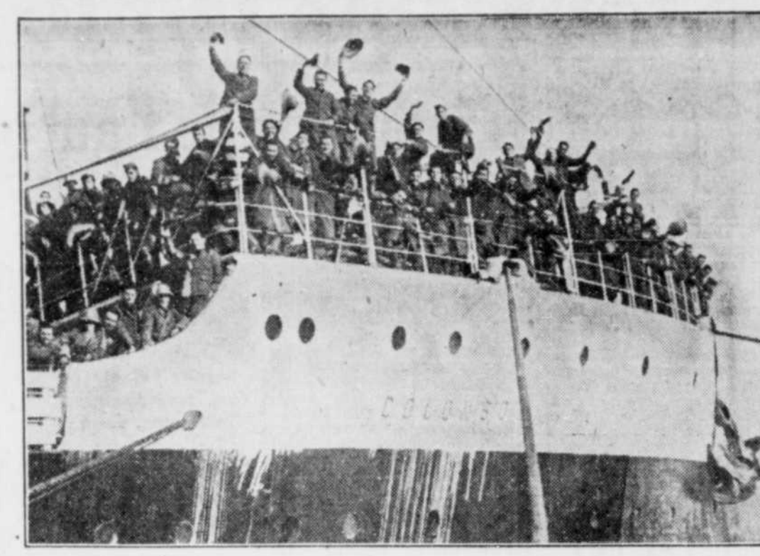
Ces jeunes soldats semblent assez joyeux en quittant leurs amis, dans un port italien, en route pour l'Afrique en vue d'une guerre entre l'Italie et l'Éthiopie.