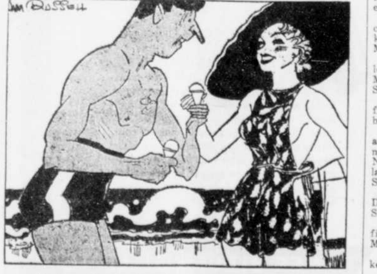
—La femme de Fred lui a-t-elle imposé quelque chose quand ils se sont mariés? — "Oui, sa mère!" — Smith's Weekly.