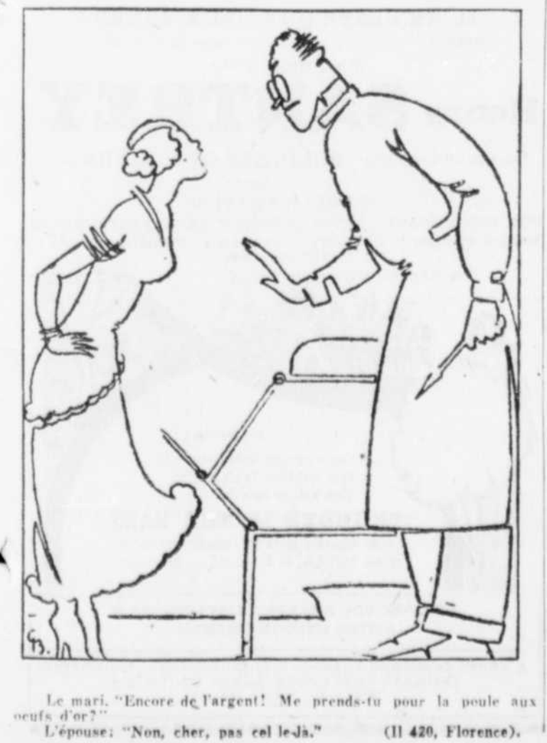
Le mari: "Encore de l'argent! Me prends-tu pour la poule aux œufs d'or?" L'épouse: "Non, cher, pas ce là-jà." (Il 426, Florence).