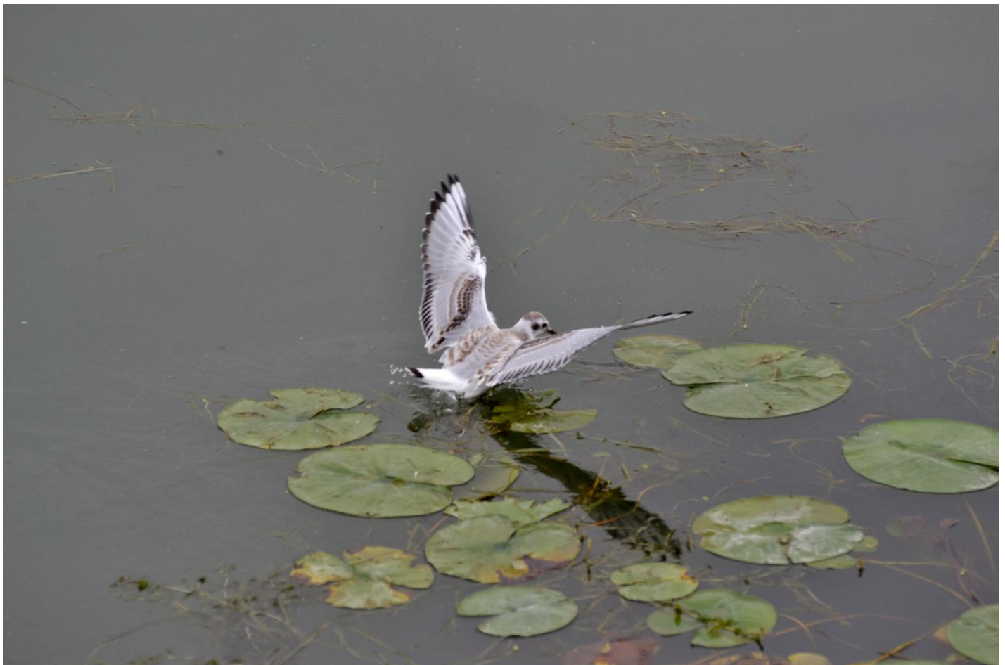
Mouette de Bonaparte, parc Regard-sur-le-fleuve

L'incroyable Bécasseau à queue pointue : Lucille Cournoyer