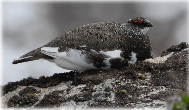
mâle au printemps

Le Lagopède des saules, qui en réalité n'est pas une perdrix, change trois fois de plumage au cours de l'année (et non pas deux comme la plupart des oiseaux). En toutes saisons, son plumage est mimétique et lui permet de se camoufler parfaitement dans son milieu ambiant, surtout les femelles.