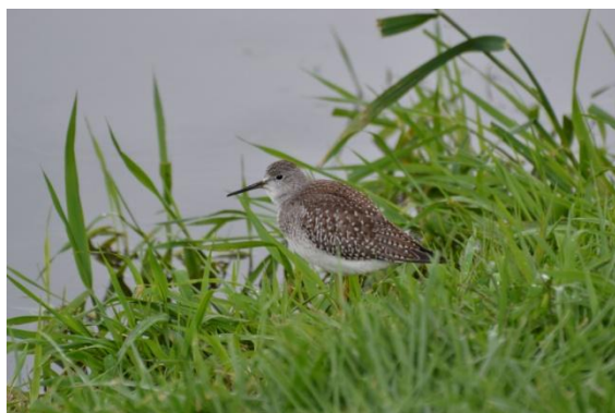
Petit Chevalier, Baie-du-Febvre