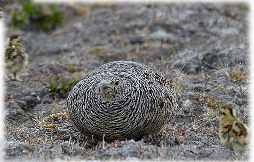
femelle en été

leurs doigts sont emplumés, ce qui facilite leur marche dans la neige