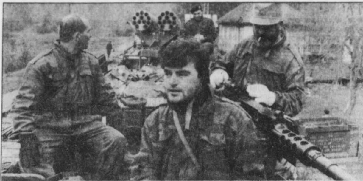
Un groupe de soldats serbes quittent l'enclave de Krajina (Croatie) à bord d'un train chargé d'armes à destination de la frontière croato-bosniaque, d'où ils pourront renforcer le siège de Bihac.

L'avenir de leur coopération s'annonce donc sombre, ce qui fait planer un doute sur la possibilité d'organiser une future et ambitieuse opération de maintien de la paix en Europe.