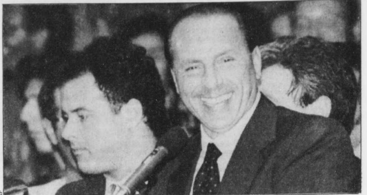
Déjà en juillet, le premier ministre italien se voyait forcé de défendre l'intégrité de son gouvernement devant les membres de son parti réunis en congrès à Rome.

Silvio Berlusconi et les syndicats ont convenu de se rencontrer mercredi pour négocier le projet de budget. Les deux parties se